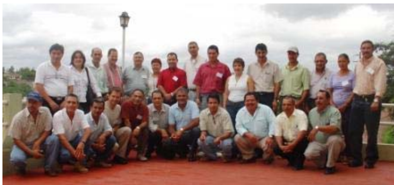
Miembros de la Junta Directiva, representantes de organizaciones de productores de café de Honduras y visitantes (Tegucigalpa, Honduras)