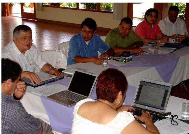
Reunión del Comité Coordinador de la Red de Café de la CLAC; Matagalpa, Nicaragua, los días 2 y 3 de agosto de 2006.