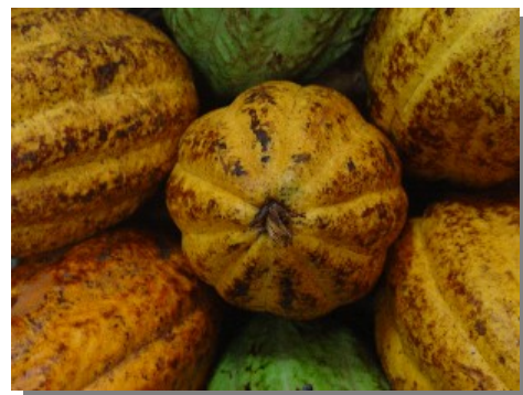
La Fruta del Cacao (República Dominicana)

Los países que NO necesitan Visa o Tarjeta de Turista para entrar a República Dominicana son: