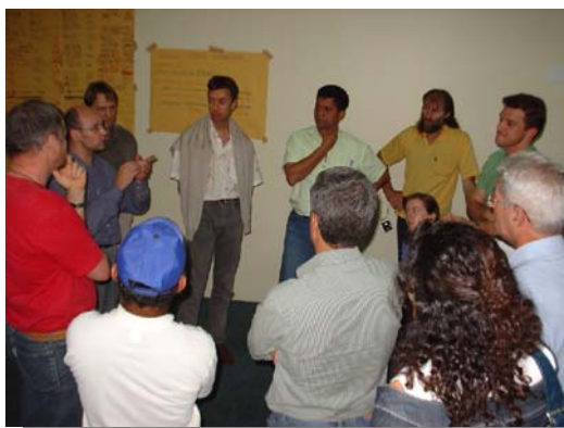
Reunión de personal de FLO, Iniciativas Nacionales y Organizaciones de Productores de Brasil, Vitoria (ES) Brasil, 27/sept/2006

En los últimos meses ha habido una rica variedad de reuniones y Asambleas de las Coordinadoras Nacionales y Redes de Producto de la CLAC. Nos llegaron noticias de países tan variados como Brasil, Guatemala, Nicaragua, Honduras, Perú, República Dominicana, México y Colombia y por otro lado de productos como banano, café, miel y cacao.