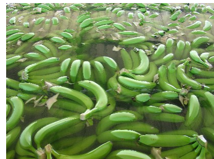
Lavado de bananos en las instalaciones de Banelino, República Dominicana

Una vez hechos y notificados a clacppcj@prodigy.net.mx los nombramientos formales de delegados y una vez autorizados los observadores, podrán llenar los formatos de registro disponibles en Internet y enviarlos al Comité Organizador Local ( banelinoclac@verizon.net.do ).