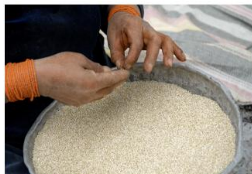
1 Encuentro de la Red Quínua