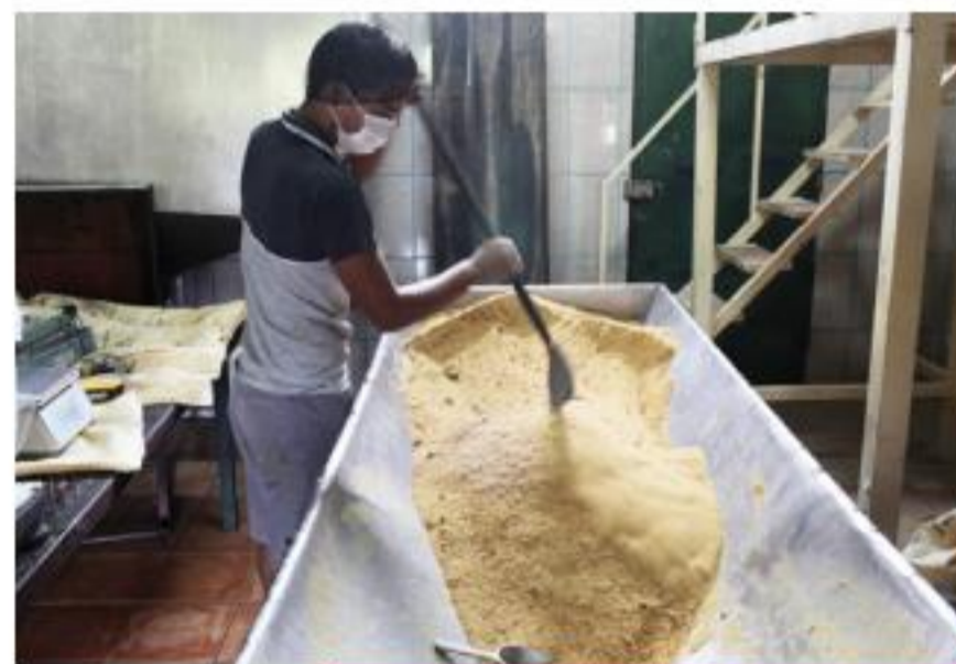
1 Encuentro de la Red Azúcar