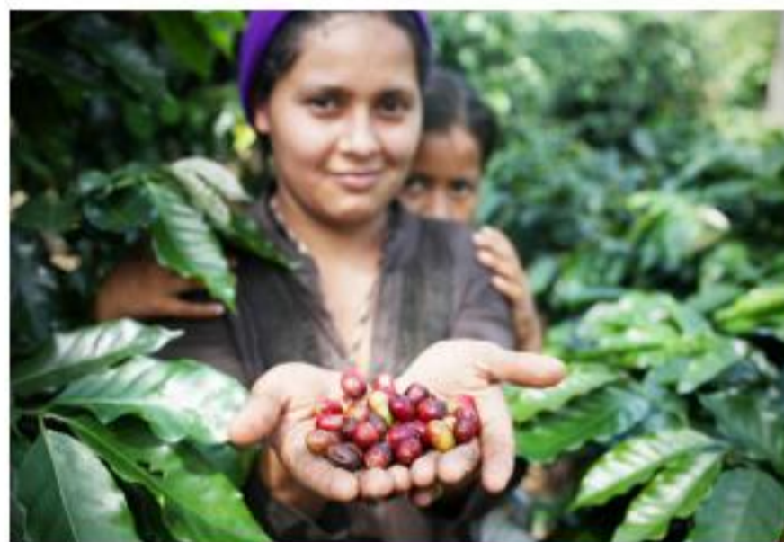
1 Encuentro de la Red Café

Finalmente, CLAC facilitó diferentes procesos de consulta en el año 2014. Por ejemplo, la consulta sobre el nuevo estándar genérico comercial, propuestas específicas sobre cómo crecer el mercado Fairtrade para café, la revisión de precios Fairtrade para banano y la consulta sobre café soluble. Además, en vista de que en el 2015 tanto en Fairtrade International