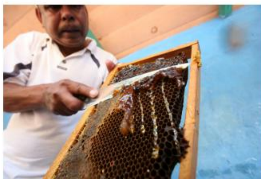
1 Encuentro de la Red Miel (Pauval)