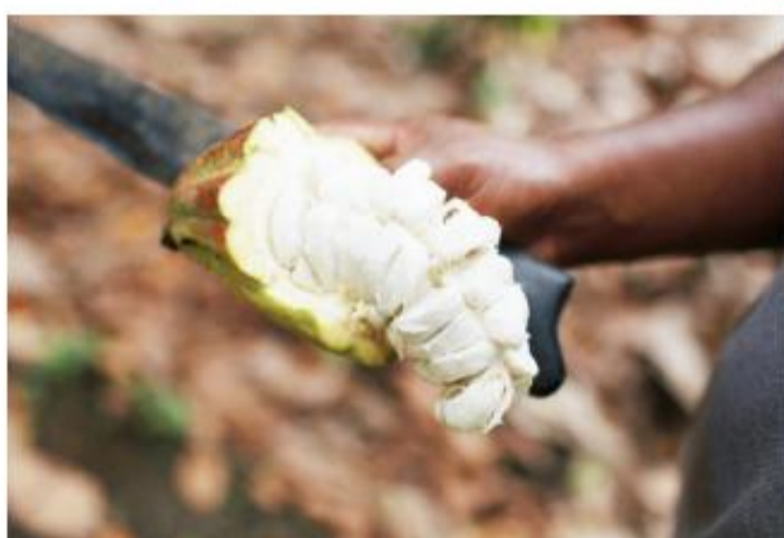
1 Encuentro de la Red Cacao

como en CLAC se decidirá sobre un nuevo plan estratégico en sus respectivas Asambleas Generales, la CLAC realizó en 16 países diferentes, con organizaciones de pequeños productores como con organizaciones de trabajo contratado, consultas sobre el rubro estratégico a seguir para Fairtrade International y CLAC.