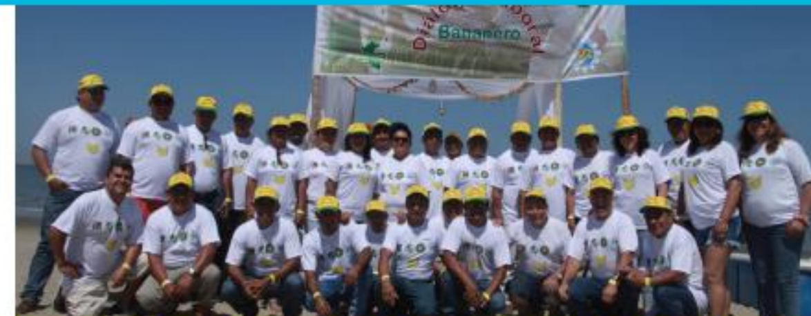
Asamblea Mesa de Diálogo en OPPs de Banano

En la parte representativa y política, la coordinadora asumió, con el apoyo de CLAC, la organización de la VII Asamblea General de CLAC, que se realizó el 8 y 9 de noviembre en Lima. Durante la Asamblea, se aprobó el Plan Estratégico de CLAC 2019-2021 y se eligió al nuevo Consejo Directivo de CLAC para el mismo periodo.