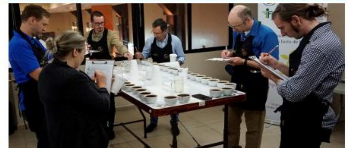
ECOJUSTOH - 2018