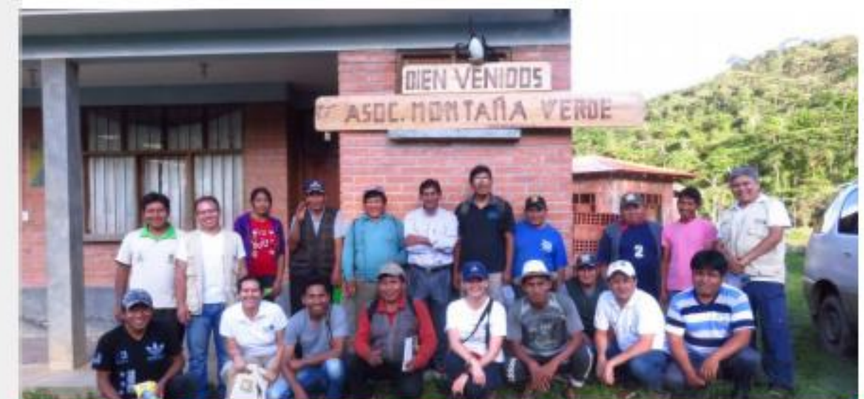
Evaluación proyecto LIDL con jóvenes