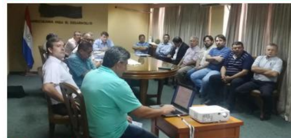
Elaboración Plan Nacional de Azúcar