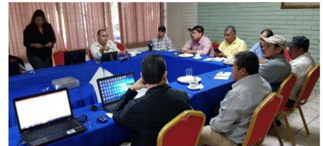
Construcción del plan de incidencia