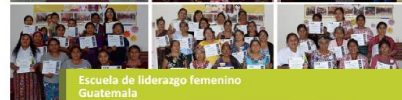
Escuela de liderazgo femenino Guatemala