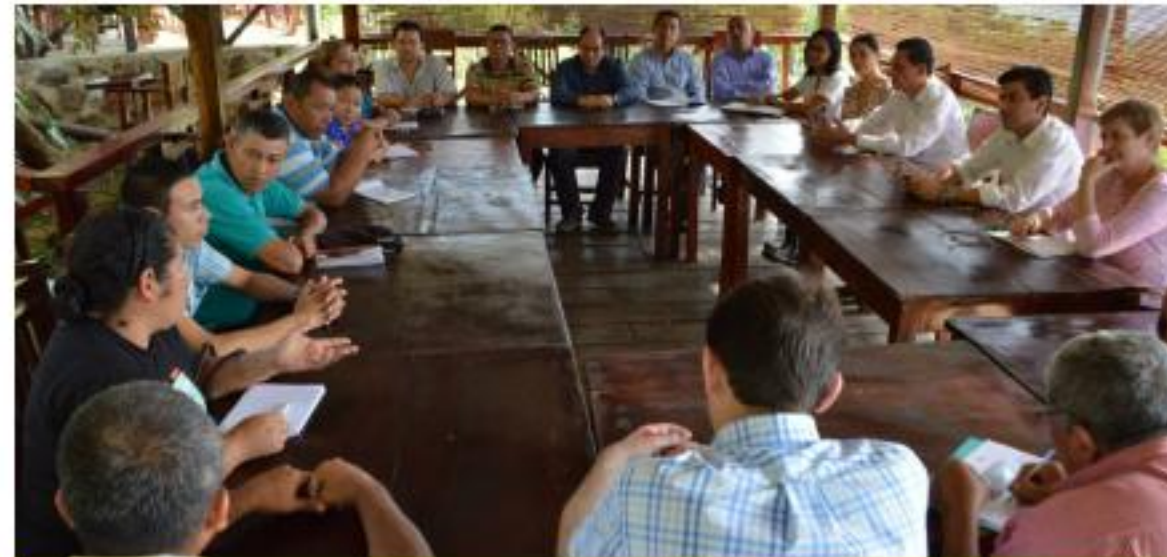
Alianza con la Fundación FIAT