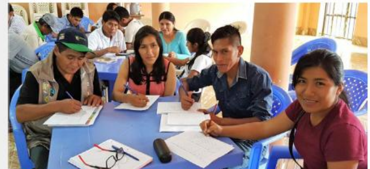
Taller de jornada empresarial con jóvenes