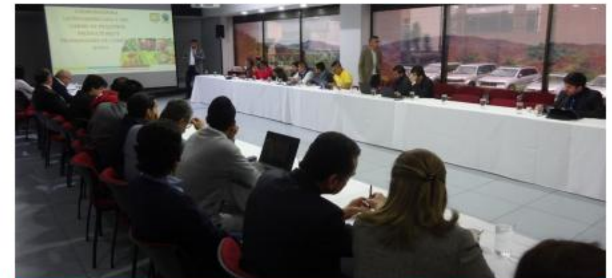
Reunión con Flocert y CLAC