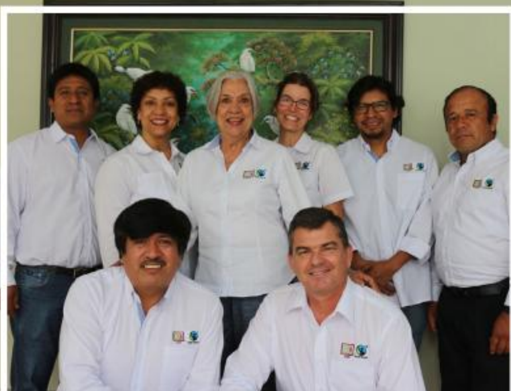
Comisión de Estándares de CLAC

CLAC ha organizado el trabajo de estándares a nivel operativo desde la coordinación de estándares y a nivel político en la Comisión de Estándares (CECLAC). Así, se ha logrado dar seguimiento a todos los procesos de revisión, desarrollo e implementación de los estándares de Fairtrade International (FI).