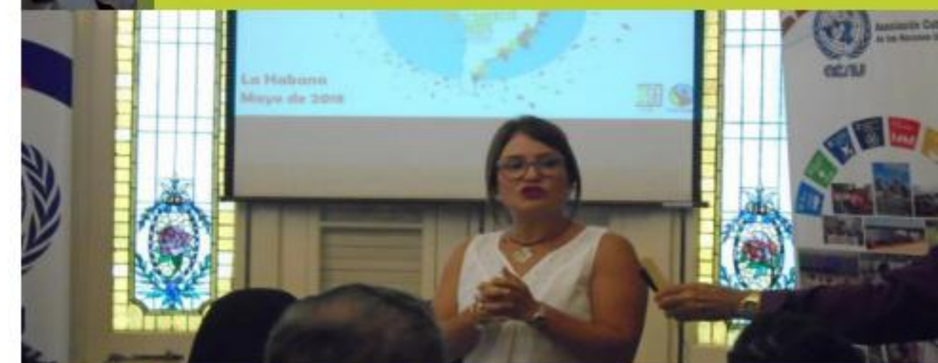
Celebración día del comercio justo Cuba