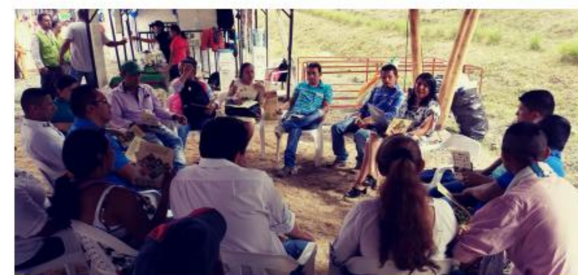
Visita ASOPEP, Tolima