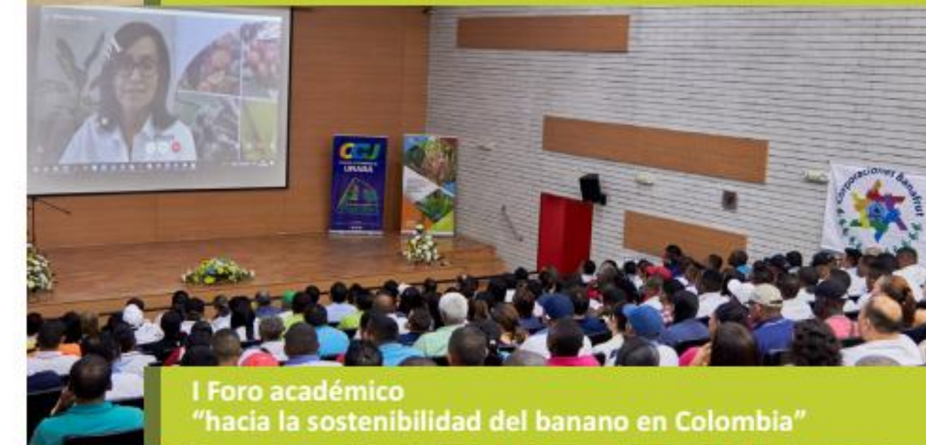
I Foro académico “hacia la sostenibilidad del banano en Colombia”