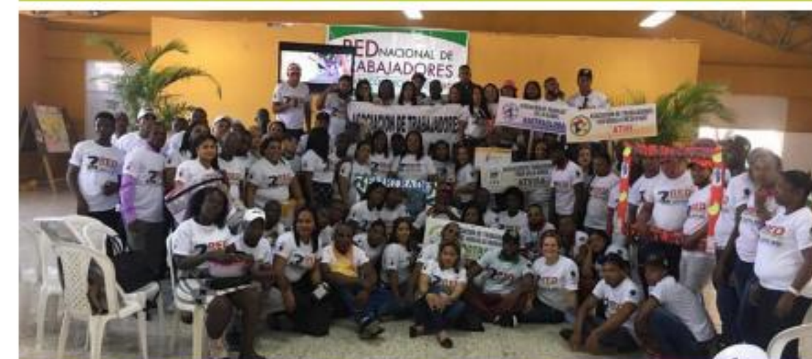
Red Nacional de Trabajadores(as)