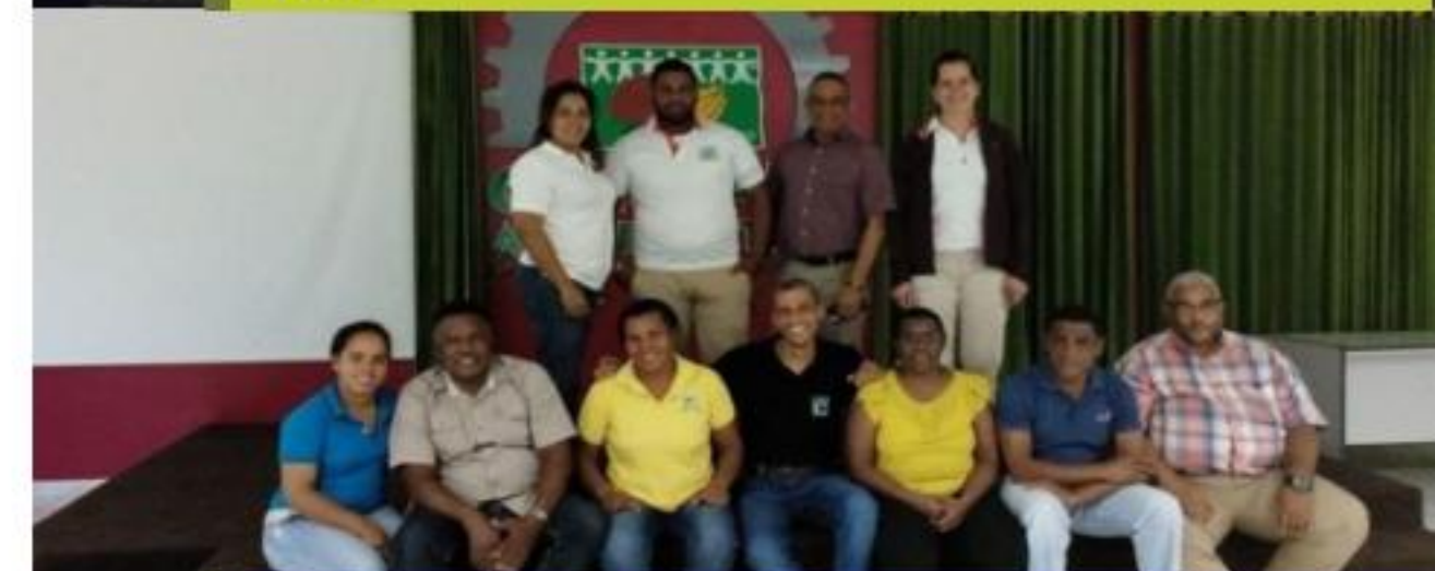
Taller de inducción a proyecto República Dominicana y Haití