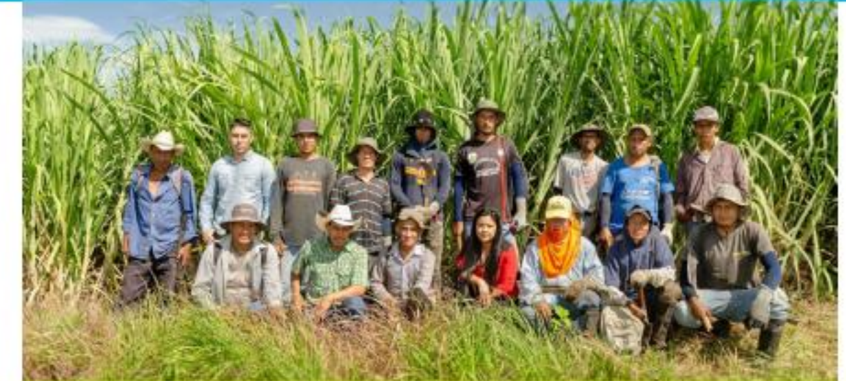
Proyecto PDI, El Sunza