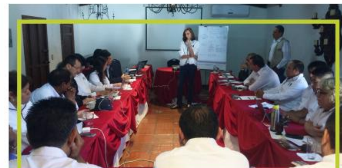
Reunión Consejo Directivo entrante y saliente

De igual forma, el consejo recibió el informe y recomendaciones del Comité de Vigilancia, las cuales fueron compartidas en el foro de la VII Asamblea.