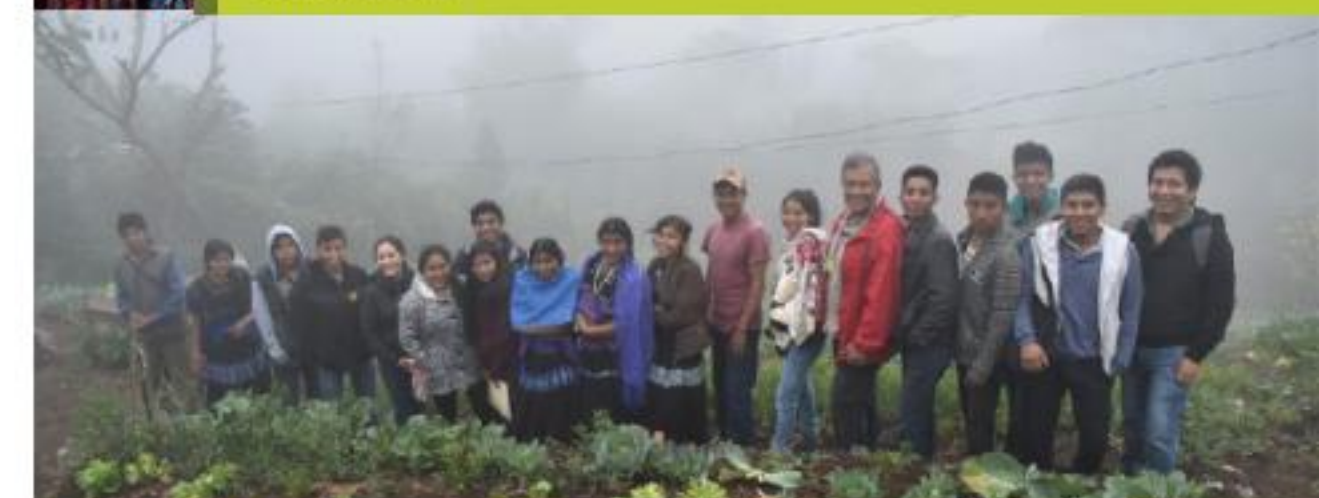
Huerto en Majomut, soberanía alimentaria México