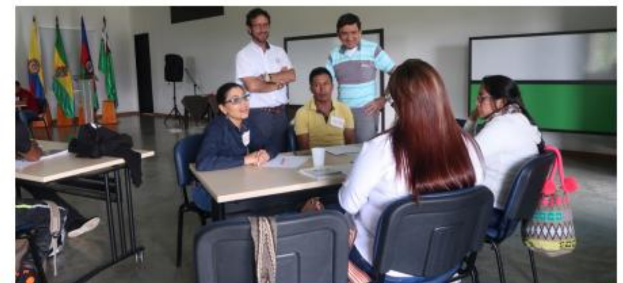
Seminario taller con jóvenes