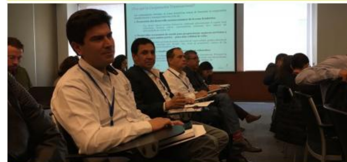
Reunion Ciudad de México INNOVACT UE

Con el apoyo de CLAC y con el financiamiento de Fairtrade Finlandia, se dio inicio a los proyectos Miel para el Futuro e INTERCAMBIO, donde participan 7 organizaciones miembros de la coordinadora. Es de destacar que, en ambos proyectos, la CGCJ participó en el proceso de planificación.