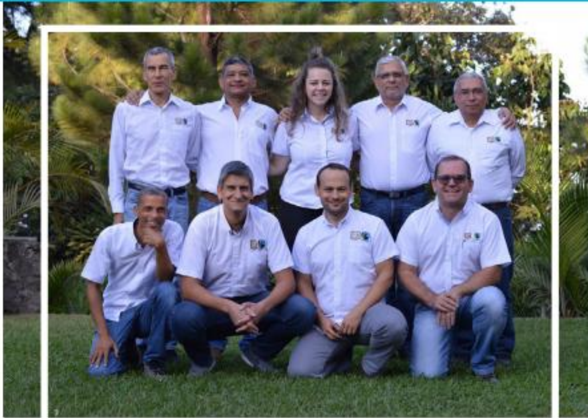
EQUIPO DE PRODUCTOS Y MERCADO

2018 fue un año de mucho trabajo para las diferentes redes de producto, las cuales agrupan a los representantes de las organizaciones de productores(as) de los principales productos de Comercio Justo de América Latina y el Caribe (café, cacao, banano, azúcar, miel, jugos y frutas, quinua).