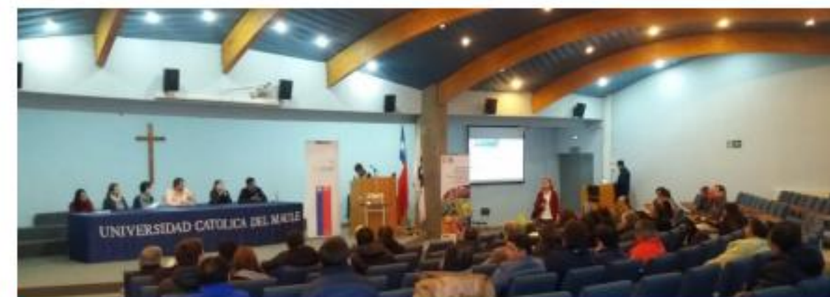
Universidad Católica de Maule

Para las universidades, se lograron grandes avances en articulación con el medio y beneficios de proyectos participativos con la Universidad Católica del Maule y la Universidad de Santiago, con quienes se firmó el Convenio de Voluntades antes de finalizado el año 2018.