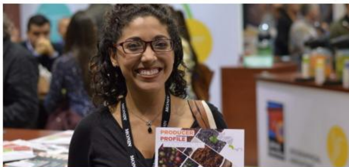
Promoción de cafés Fairtrade de Costa Rica