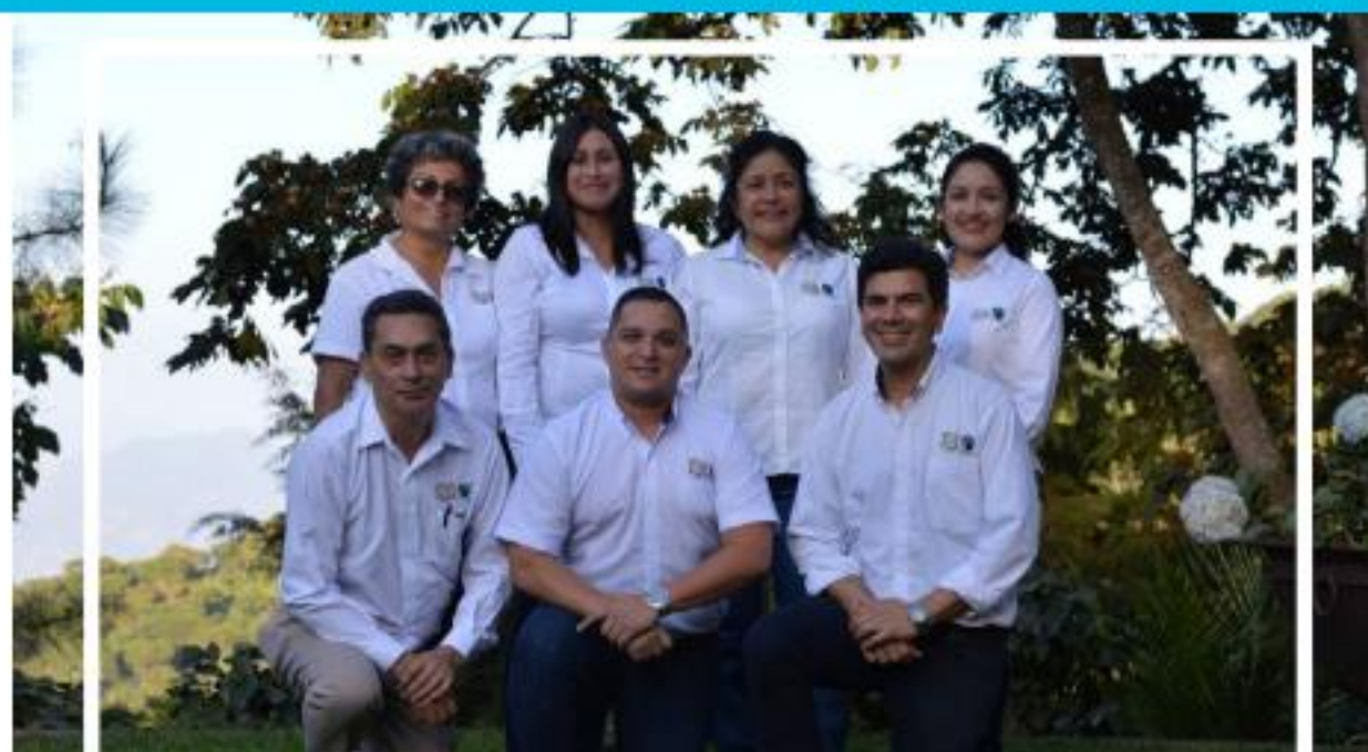
REGIÓN CENTRO AMÉRICA Y MÉXICO

En Centroamérica y México se cuenta aproximadamente con unas 200 organizaciones. La mayoría son organizaciones de café (México, Guatemala, El Salvador, Honduras, Nicaragua, y Costa Rica), seguido por miel (México, Guatemala y Nicaragua). Pero también hay organizaciones que producen banano (Costa Rica, Panamá y México), otras frutas frescas (Costa Rica, México), verduras (Guatemala, México), cacao (Panamá, Costa Rica, Nicaragua) y azúcar (Costa Rica, El Salvador) en la región.