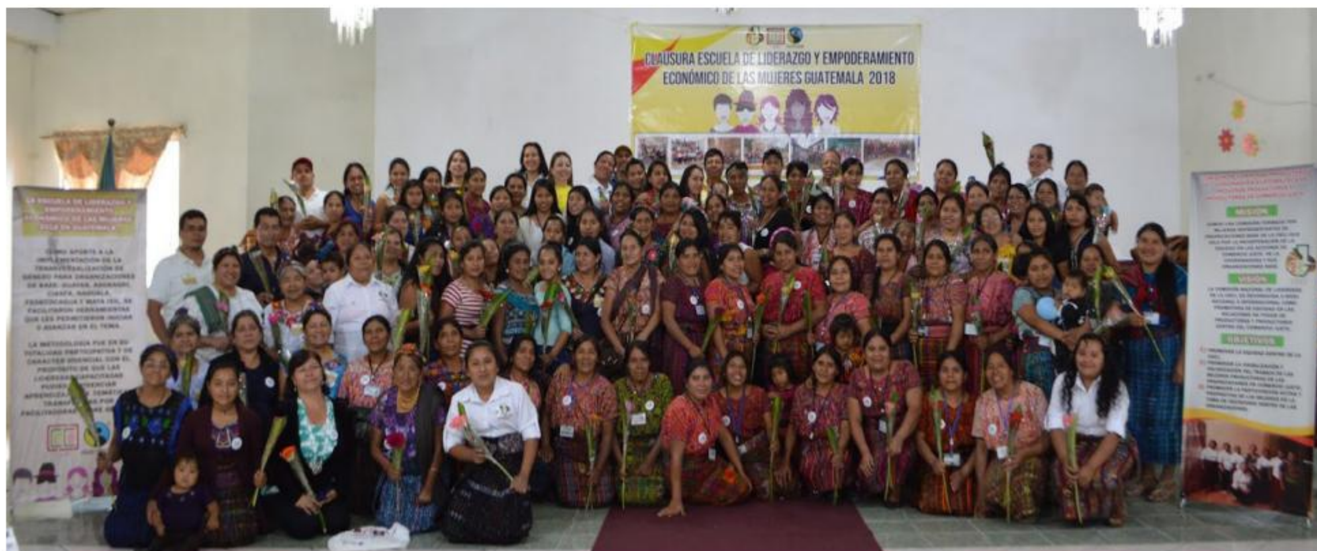
CLAUSURA DE ESCUELA DE LIDERAZGO PARA MUJERES - GUATEMALA

Entre ellas la implementación de Escuelas de liderazgo en 8 OPPs de Guatemala y El Salvador con la participación de 160 mujeres, talleres de entrenamiento sobre el uso de la caja de herramientas para la transversalización de género con participación de México, Guatemala, El Salvador, Ecuador y Colombia. En dichas acciones se ha contado con la participación de 1,345 personas, el 47% mujeres y 53% hombres, de 16 países (Costa Rica, República Dominicana, Guatemala, El Salvador, México, Nicaragua, Colombia, Perú, Ecuador, Argentina, Paraguay, Brasil, Perú, Bolivia, Ecuador, Cuba).