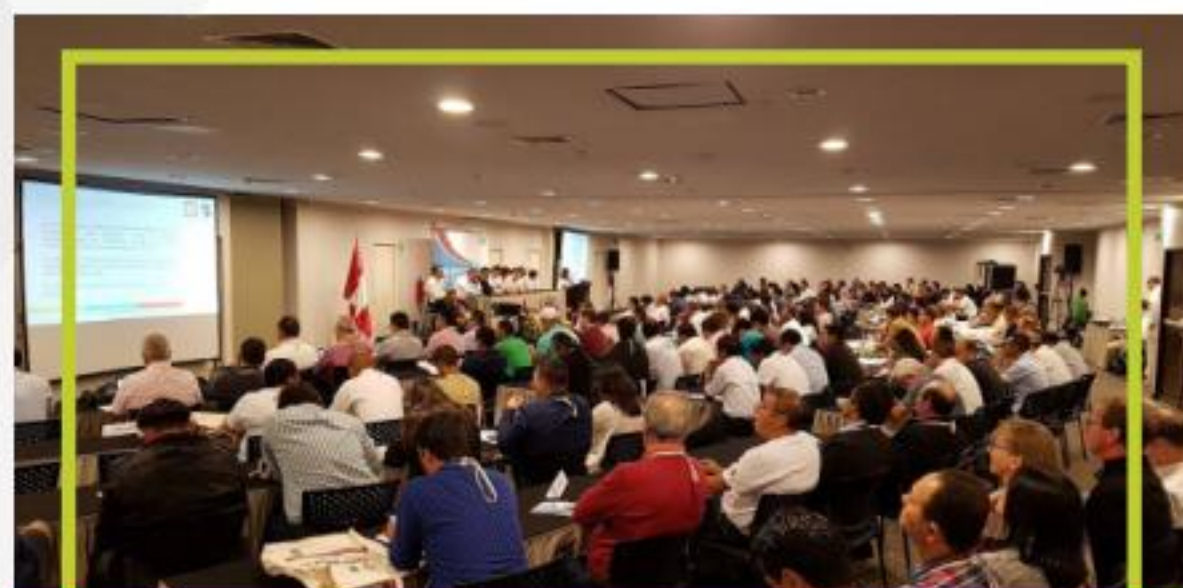
VII Asamblea General CLAC Noviembre 2018