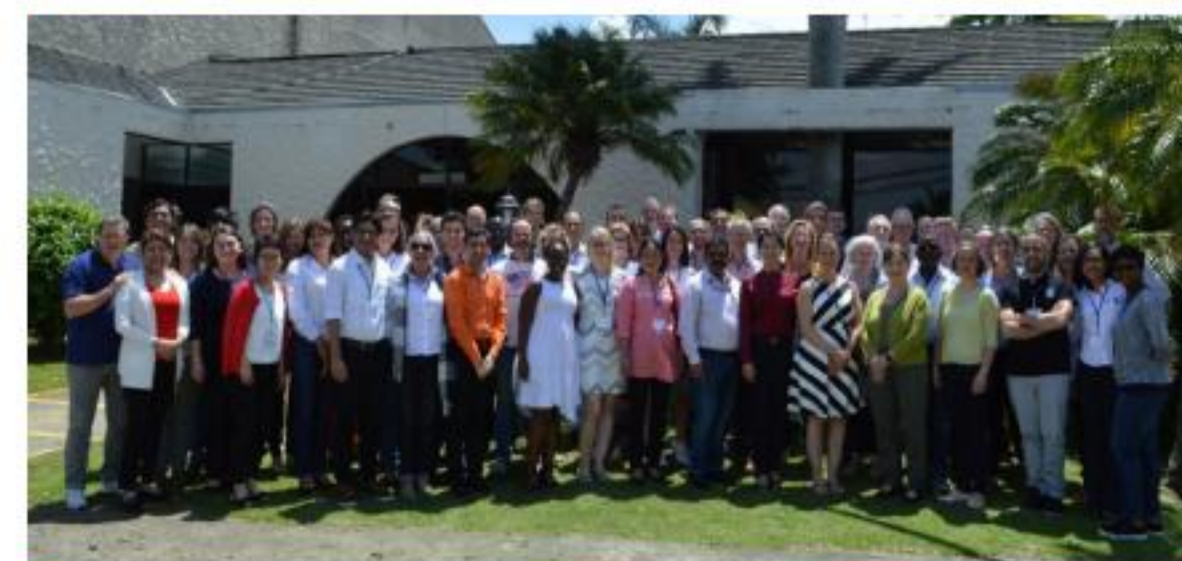
Asamblea Fairtrade Internacional