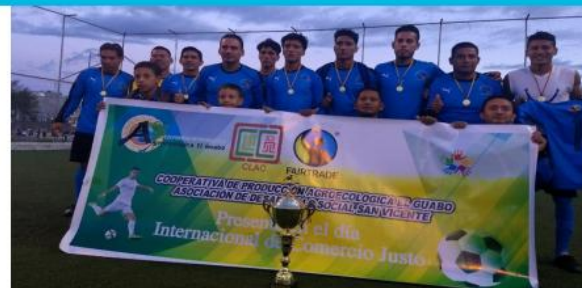
Campeonato de futbolito

Otra actividad importante fue la ejecución del proyecto “innovaciones de pequeños productores de Comercio Justo para los consumidores orgánicos de Europa”, financiado por CORPEI y por las organizaciones beneficiarias, con el objetivo de mejorar los ingresos de los(as) pequeños(as) productores(as) asociados(as) en 5 cooperativas socias de la CECJ (FAPECAFES, UROCAL, JAMBI KIWA, COPROBICH Y ASOPROCAM), mediante acceso al mercado orgánico y Comercio Justo de Europa. El convenio correspondiente a este proyecto se firmó el 14 de marzo del 2018 y se espera que se ejecute en un plazo de 18 meses.