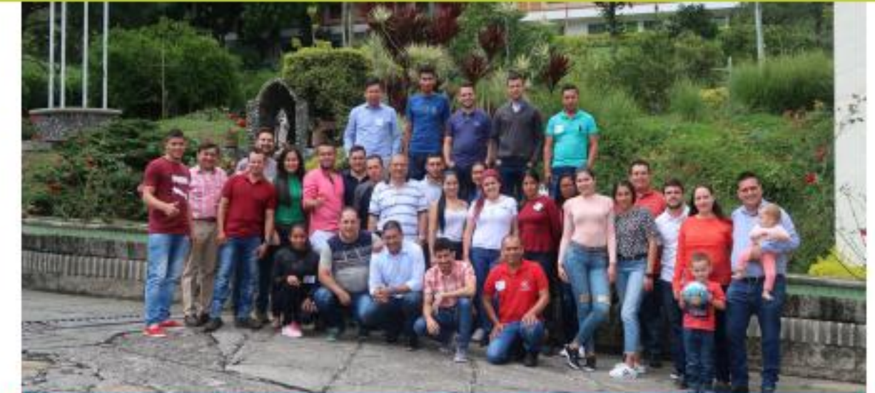
Encuentro de jóvenes, desarrollo de liderazgo

En cuanto infraestructura, se realizaron obras en conjunto con los caficultores, como por ejemplo secaderos, beneficios, marquesinas, así como actividades para el mejoramiento del servicio al caficultor, puestos de compra y almacenamiento de café y mejoramiento de trilladoras. Finalmente, se destaca el apoyo a los(as) productores(as), a través de sobrepeso y aportes para el mejoramiento del ingreso al caficultor.