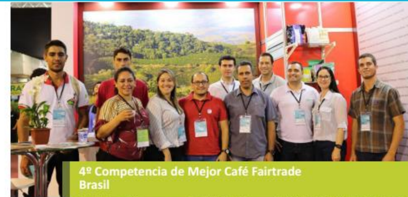
4º Competencia de Mejor Café Fairtrade Brasil

En Paraguay, se destaca el trabajo en diagnósticos participativos con algunas organizaciones de base, como también la excelente organización del II Encuentro Internacional de Jóvenes en Comercio Justo. En Argentina y Uruguay la Coordinadora binacional ha sido acompañada en su proceso de creación y se ha logrado organizar un taller interesante de caracterización de miel, donde participaron apicultores certificados de Argentina, Chile y Uruguay, dictado por especialistas del INTA (Argentina) y Ecosur (México). En Chile, se ha apoyado a la Coordinadora Nacional en su colaboración con el Gobierno para promover el Comercio Justo en el país.