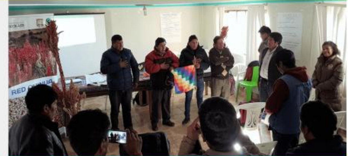
Reunión Red de Quinua

Entre los desafíos más importantes de la CNCJ-Bolivia para la siguiente gestión está la organización de eventos a nivel nacional e internacional, que fortalezcan la visibilidad y representatividad de la coordinadora. Entre dichos eventos se destacan el primer encuentro de jóvenes de Comercio Justo de la región andina, el foro de organizaciones cafetaleras de Comercio Justo en Bolivia, así como el primer encuentro de jóvenes artesanos de Comercio Justo.