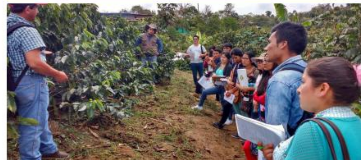
Pasantía en Jaen