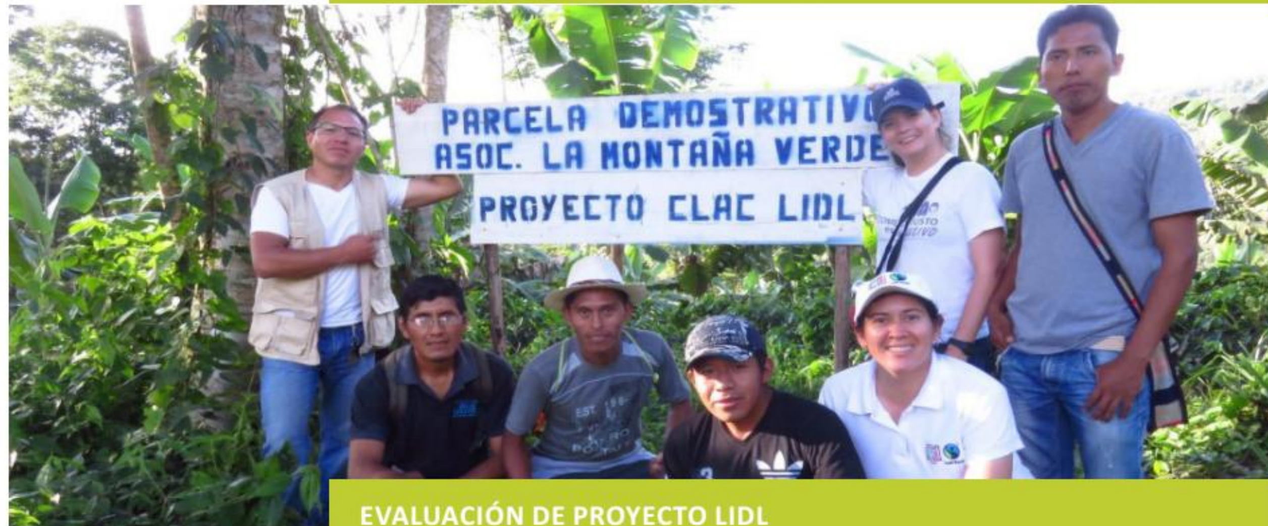
EVALUACIÓN DE PROYECTO LIDL