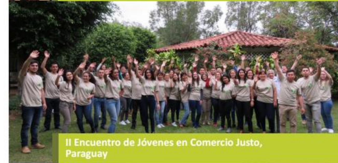
II Encuentro de Jóvenes en Comercio Justo, Paraguay