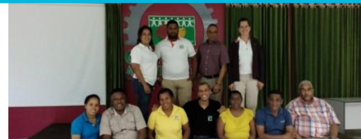
Arranque proyecto cacao

Haciendo un balance entre retos y adversidades, se llega a la conclusión de que COORDOM cuenta con las herramientas necesarias para hacer frente a las responsabilidades que le competen y con la disposición suficiente de seguir ondeando la bandera del Comercio Justo, persiguiendo intercambios comerciales más equitativos, donde la dignidad humana no se negocie y los derechos de todos(as) sean respetados.