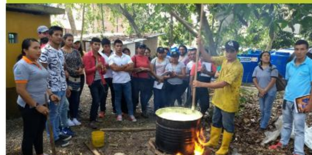
Taller de Sistema de Control Interno