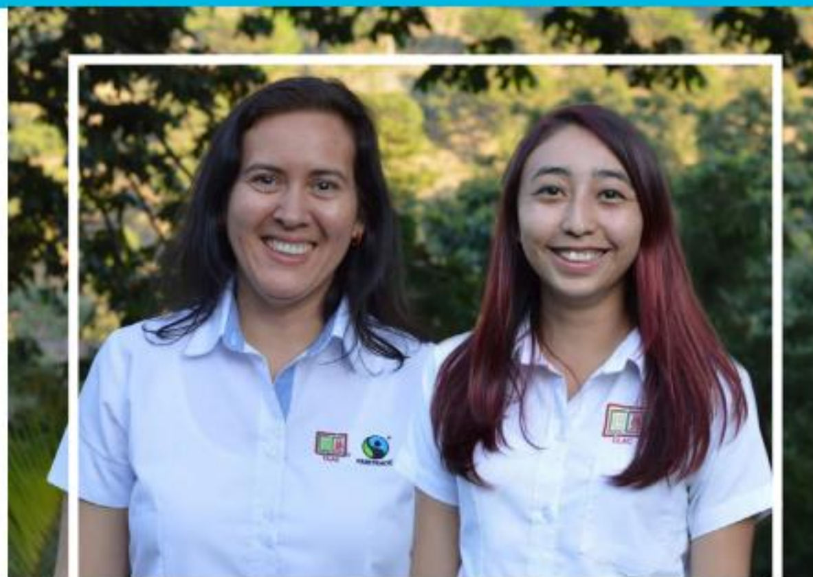
Equipo de Género / Generacional

La inclusión de mujeres y jóvenes es un elemento clave para la sostenibilidad de las familias agricultoras y de las organizaciones de Comercio Justo. Por esta razón, en CLAC se promueve el enfoque de género y generacional como parte de los ejes transversales.