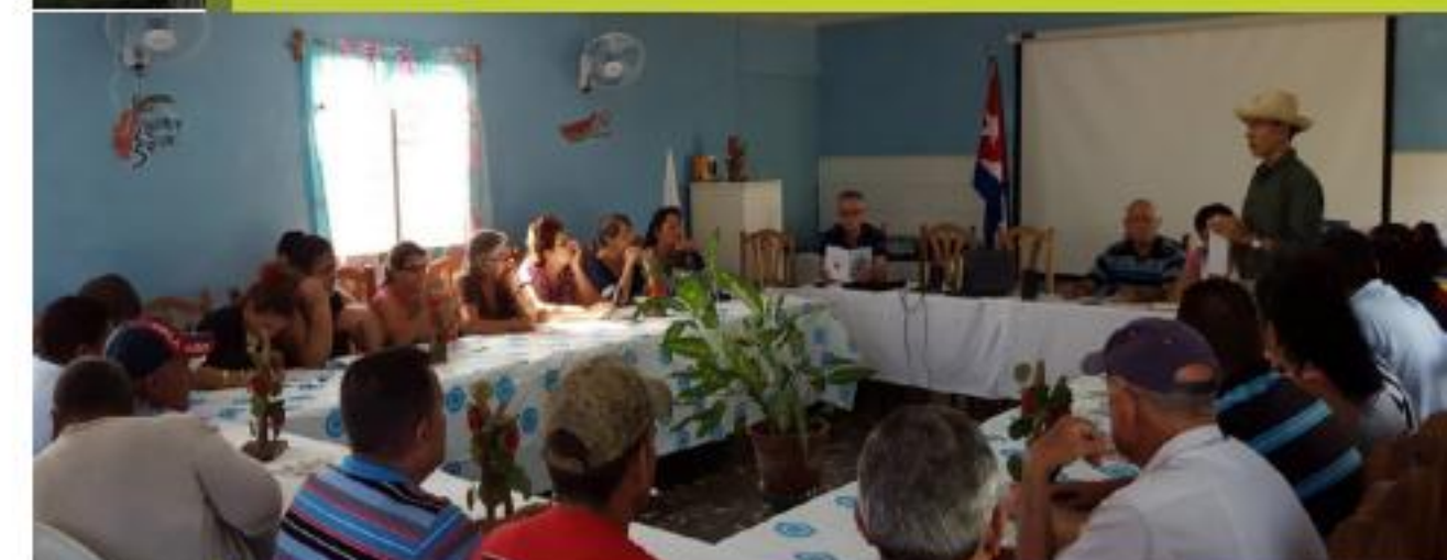
Asistencia técnica Cuba