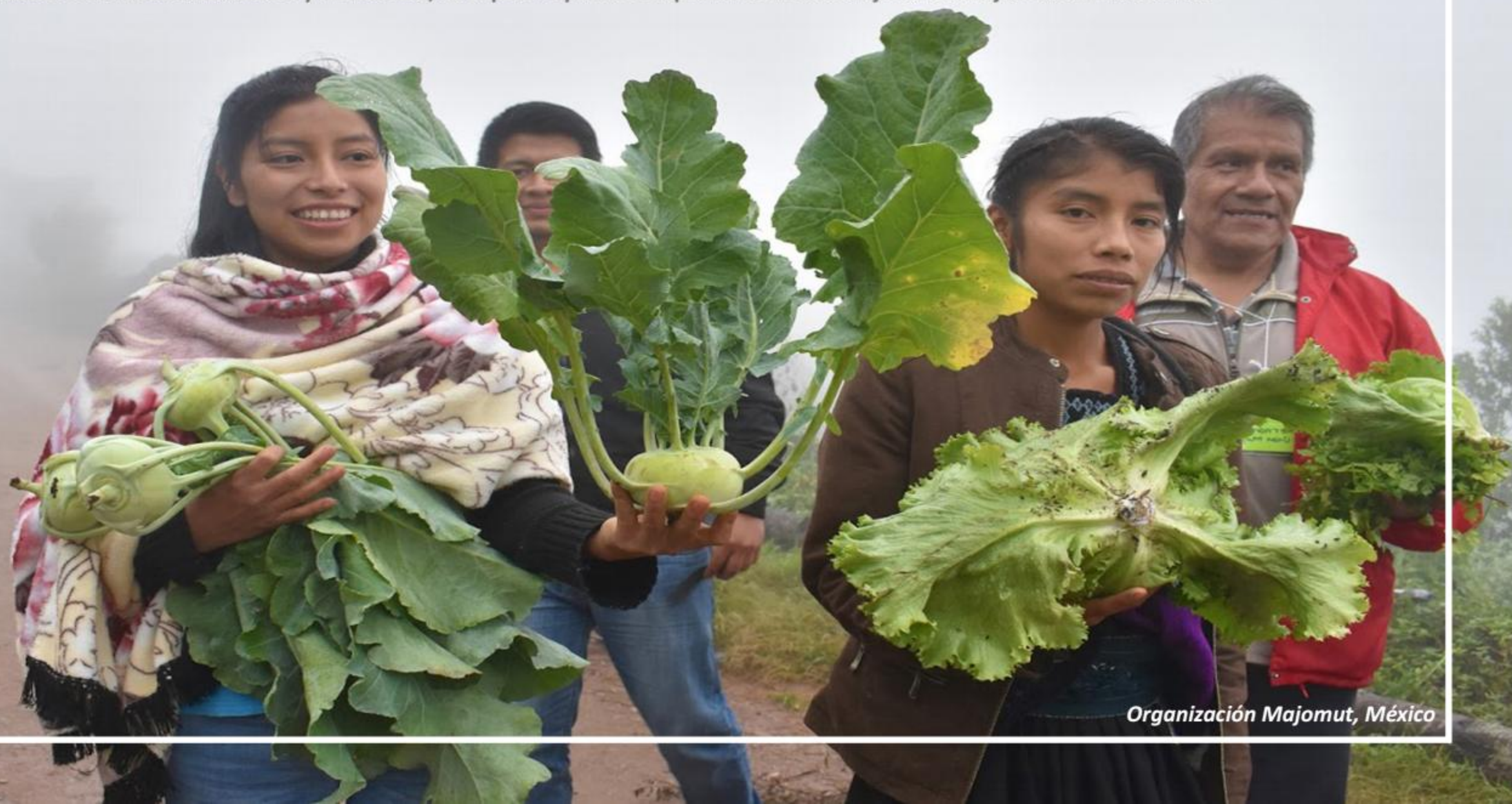
Organización Majomut, México

En el 2018 se elaboró una sistematización de la experiencia de Majomut, la cual ha servido de base para diseñar material didáctico que servirá para que nuestra membresía conozca los 10 elementos claves de la soberanía alimentaria y cómo este tema se vincula al Comercio Justo. Con la sistematización y materiales, se espera replicar la experiencia de las mujeres de Majomut en otras zonas.