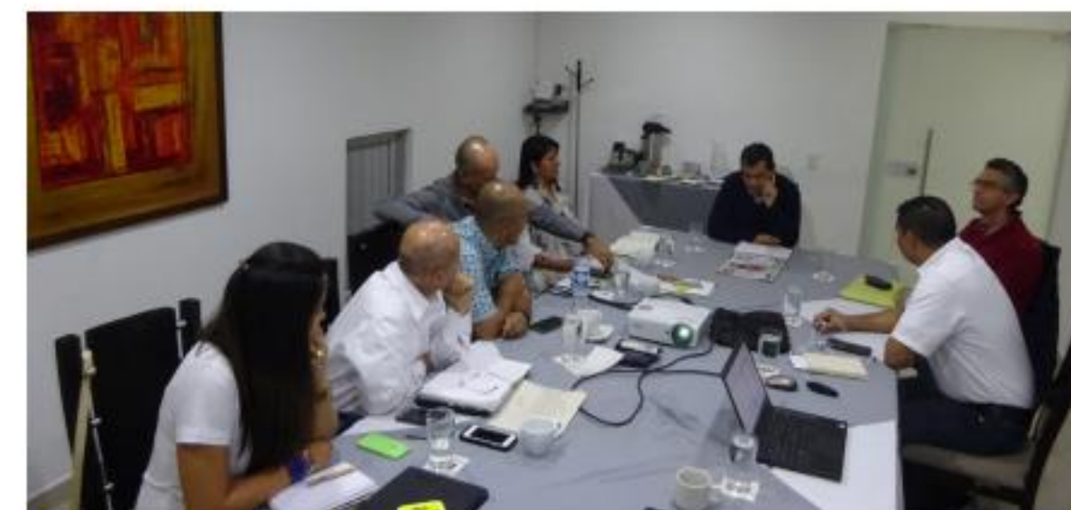
Reunión con CLAC

La Iniciativa se plantea un gran desafío, no solo en la búsqueda de mercado bajo condiciones de Comercio Justo a nivel internacional, sino también en el cómo llegar con fuerza en la promoción y difusión del Comercio Justo a nivel de Colombia.