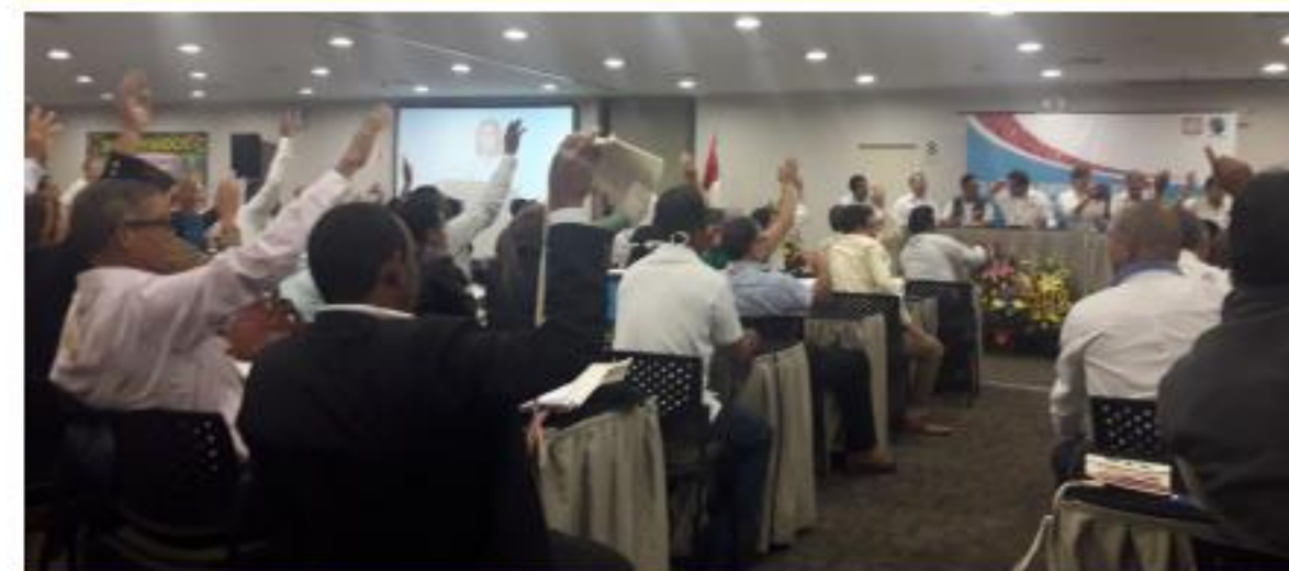
Asamblea General de CLAC