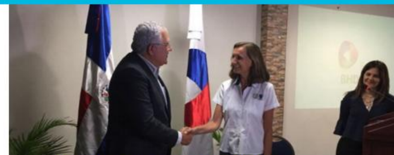
Firma de acuerdo con banco BHD León República Dominicana

Haití ha vivido este 2018 un año difícil a nivel político-social, complicando el trabajo de acompañamiento a las organizaciones en este país, mientras que en Cuba se ha podido apoyar con asistencia técnica y con la celebración del Día Internacional de Comercio Justo. Con las organizaciones de caña de azúcar en Belice, hemos podido seguir brindando la asistencia técnica a nivel productivo, como también dentro del tema de bienestar infantil.