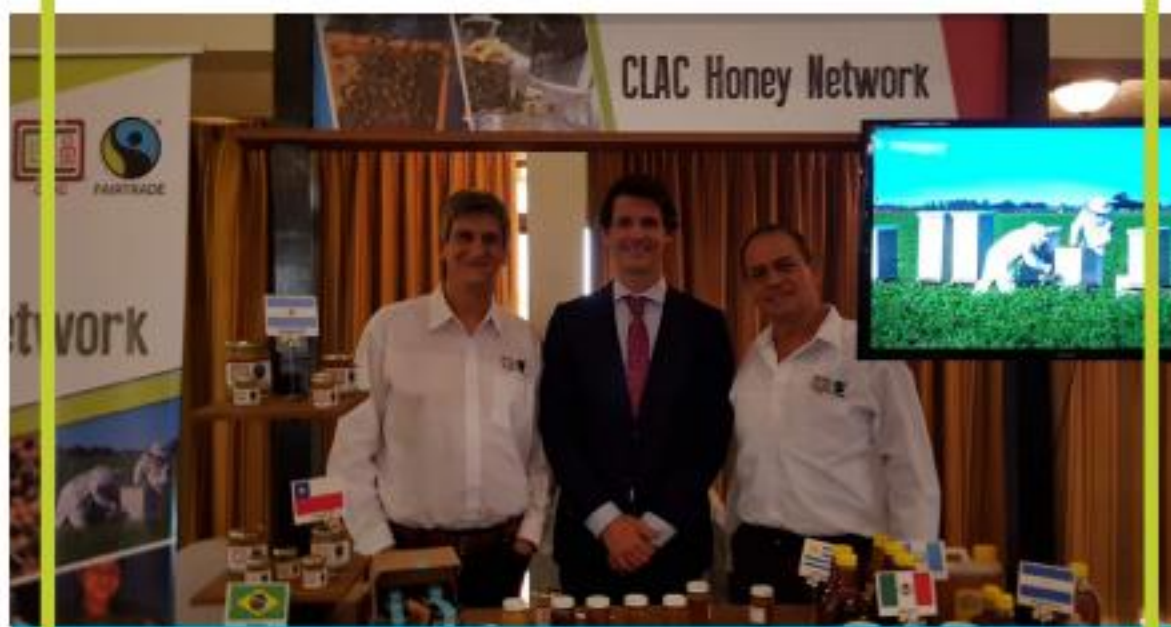
Feria de impacto Costa Rica