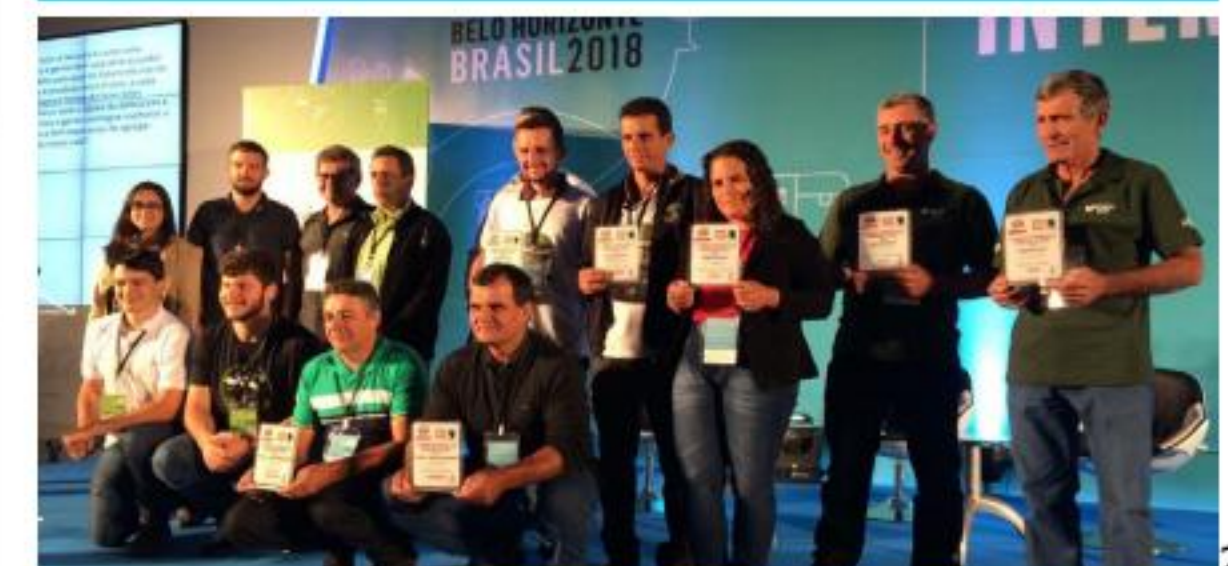
Torneo del mejor café Fairtrade