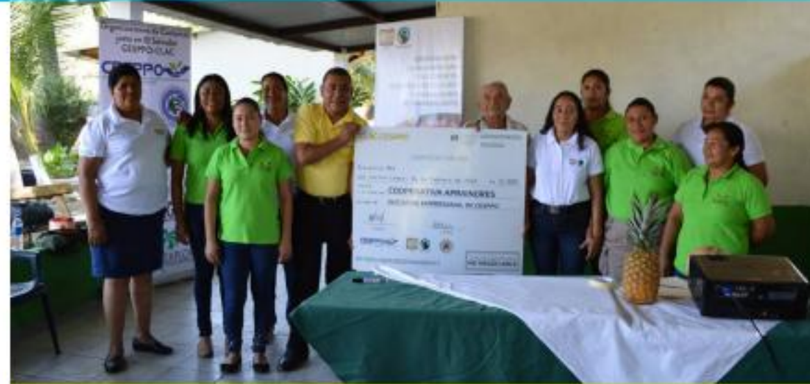
Fondo rotativo APRAINORES

En 2018, se continuó el seguimiento desde CESPPPO al desarrollo productivo, con el proyecto PDI – SUNZA, la compra de equipo de monitoreo de plagas y enfermedades, además de drones. También se apoyó a ATAISI en el proceso de certificación de su café, organización que ya cuenta con azúcar de caña Fairtrade.