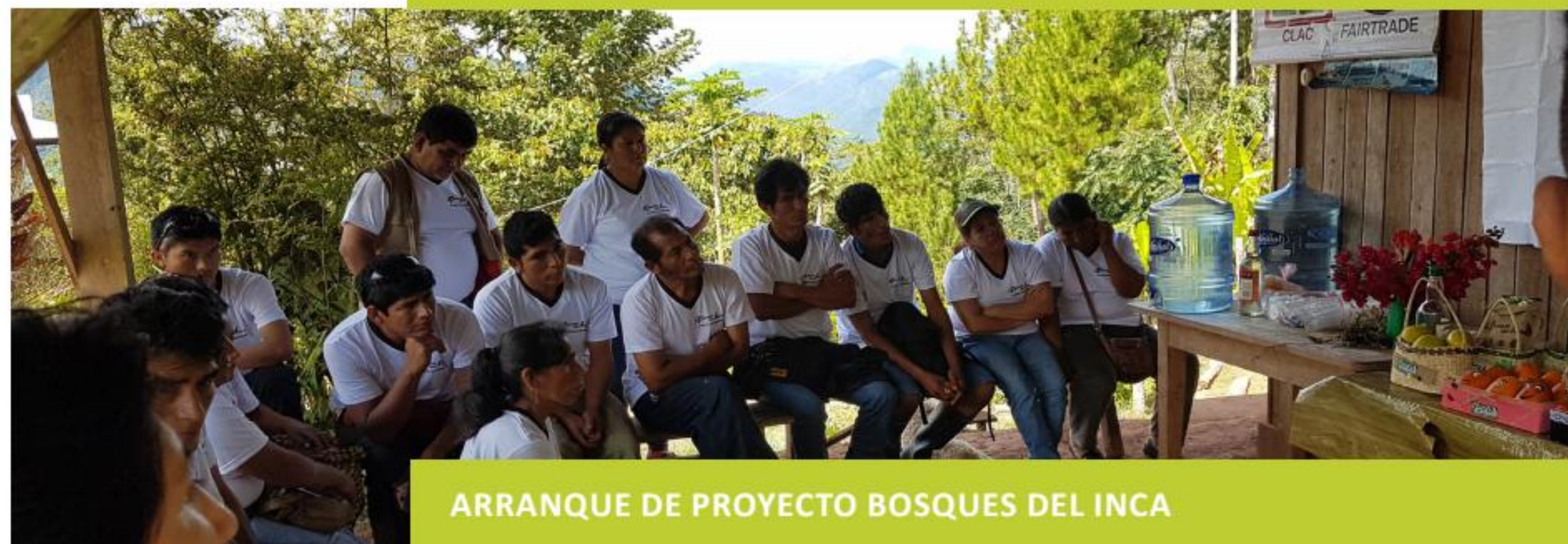
ARRANQUE DE PROYECTO BOSQUES DEL INCA