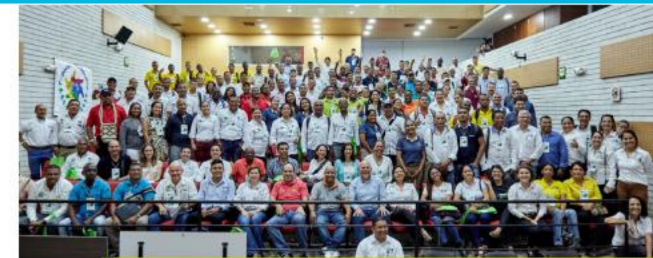
I Foro académico “hacia la sostenibilidad del banano en Colombia”

En Colombia, junto con las organizaciones de trabajadores, se ha organizado el primer Foro Académico “Hacia la Sostenibilidad del Banano de Comercio Justo en Colombia”, donde participaron 247 personas, entre pequeños productores(as), trabajadores(as), empresarios y actores del sistema Fairtrade. La Red Quinoa ha realizado en Bolivia una exitosa reunión con 64 representantes de 12 organizaciones de quinoa de Bolivia, Perú y Ecuador. En Ecuador, ya desde hace unos años se destaca una gran articulación del Comercio Justo por parte de las organizaciones de base con el Gobierno.