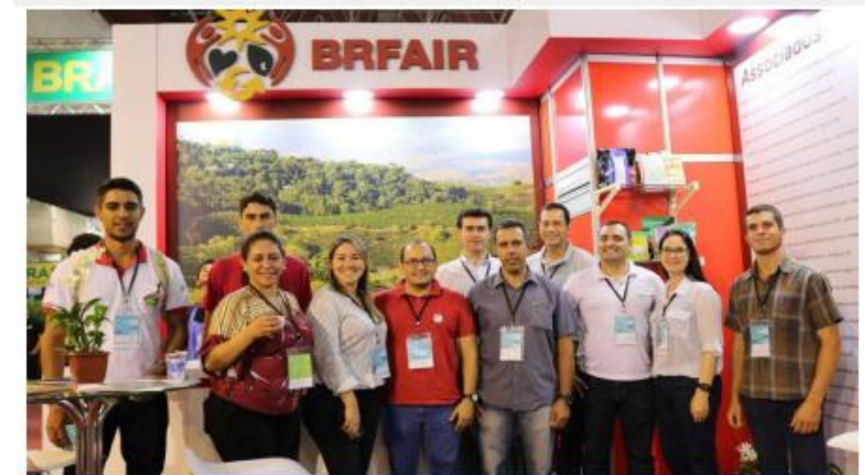
Feria de Café

Participación de los delegados de Brasil en la Asamblea General de CLAC y en la reunión de la Rede Café CLAC en Lima, del 7 al 9 de noviembre de 2018.