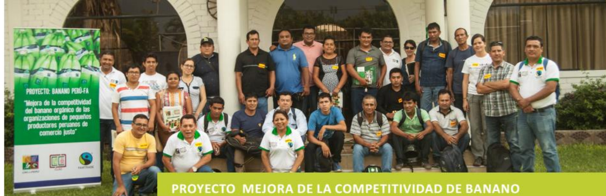
PROYECTO MEJORA DE LA COMPETITIVIDAD DE BANANO

90% de OPPs con equipo técnico, promotores y/o directiva capacitados en CC y replican capacitaciones en sus bases, hasta el 2018, superando la meta planteada al inicio del proyecto.