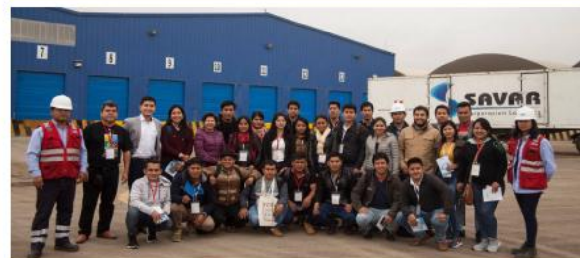
Curso de exportaciones