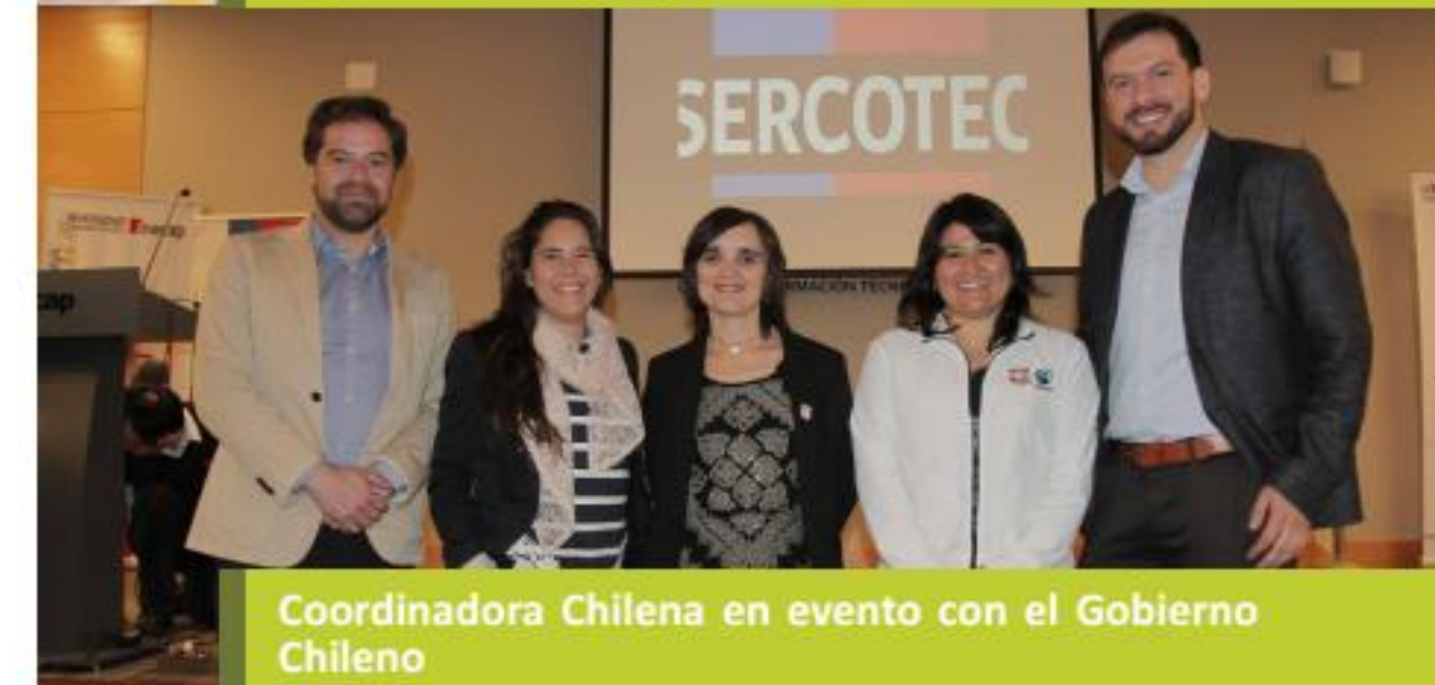
Coordinadora Chilena en evento con el Gobierno Chileno