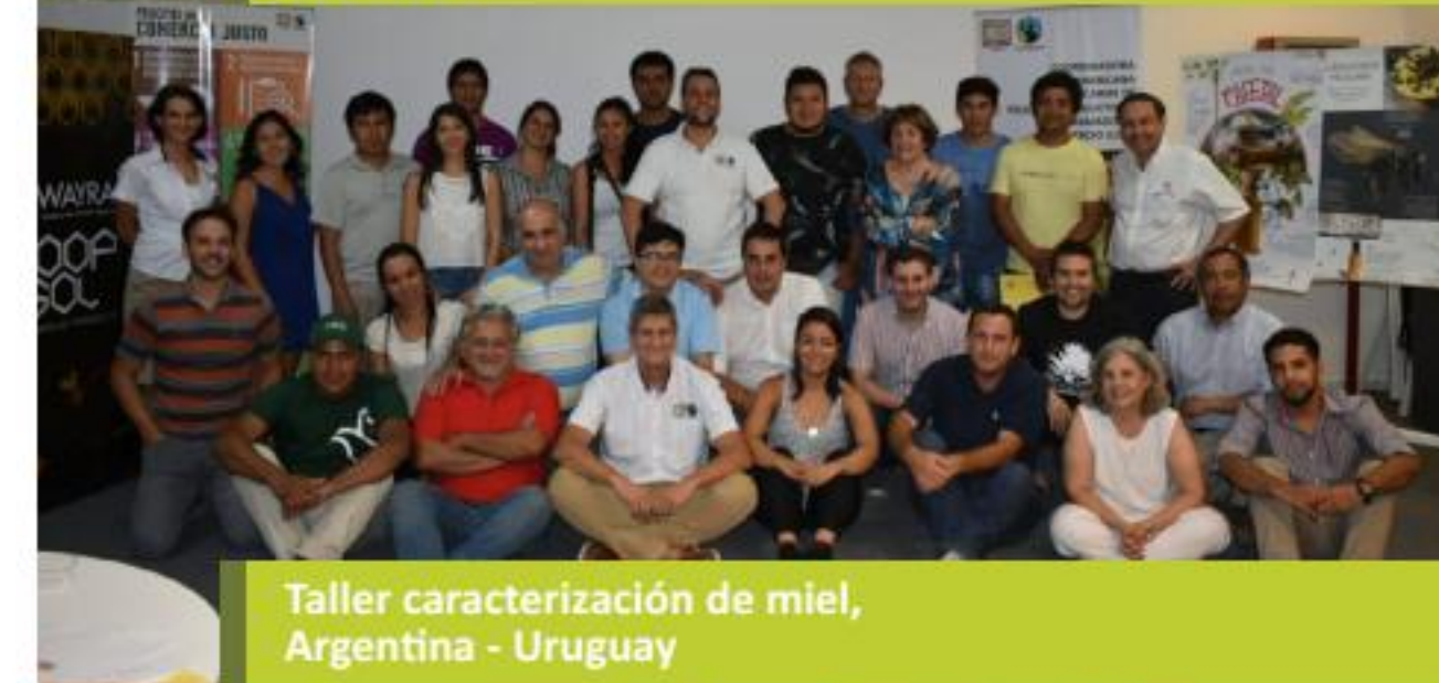
Taller caracterización de miel, Argentina - Uruguay