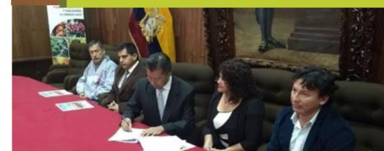
Foro académico con autoridades de Riobamba, Ecuador