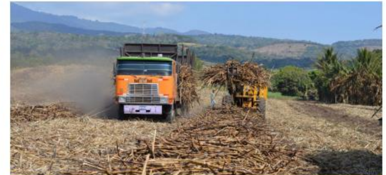
Azúcar certificada en ATAISI