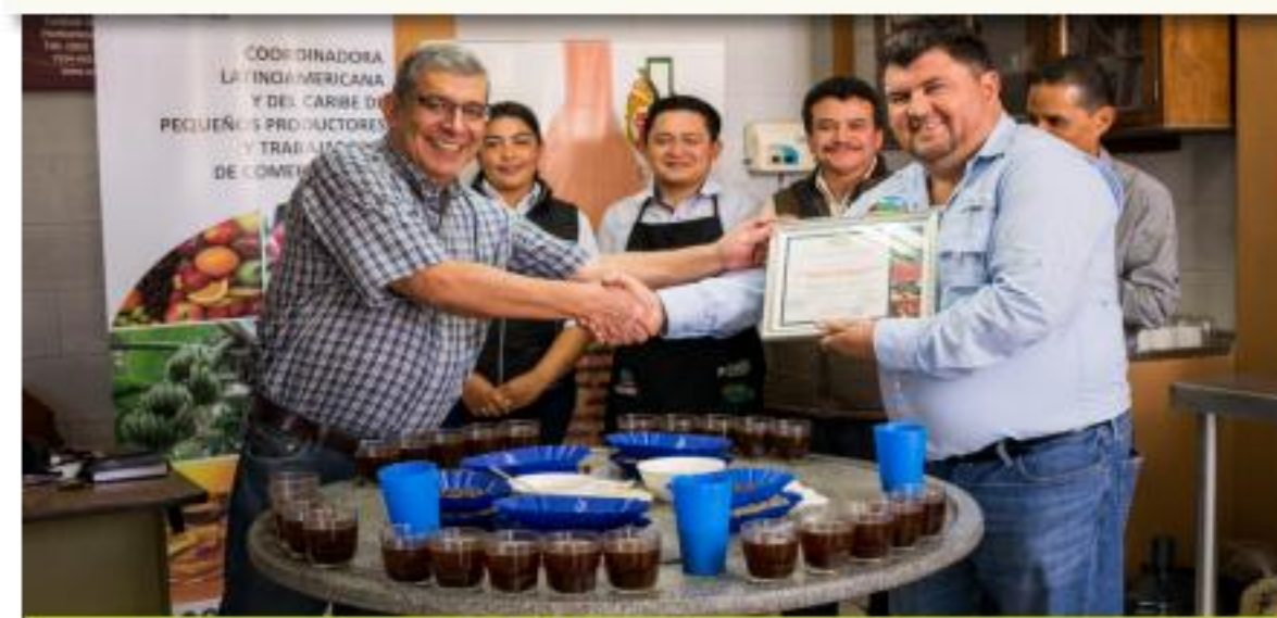
Concurso de catación

En el mismo contexto, se acudió a otras instancias gubernamentales mexicanas y guatemaltecas y de ECOSUR de México. Adicionalmente se participó en diferentes reuniones y en una gira por Europa.