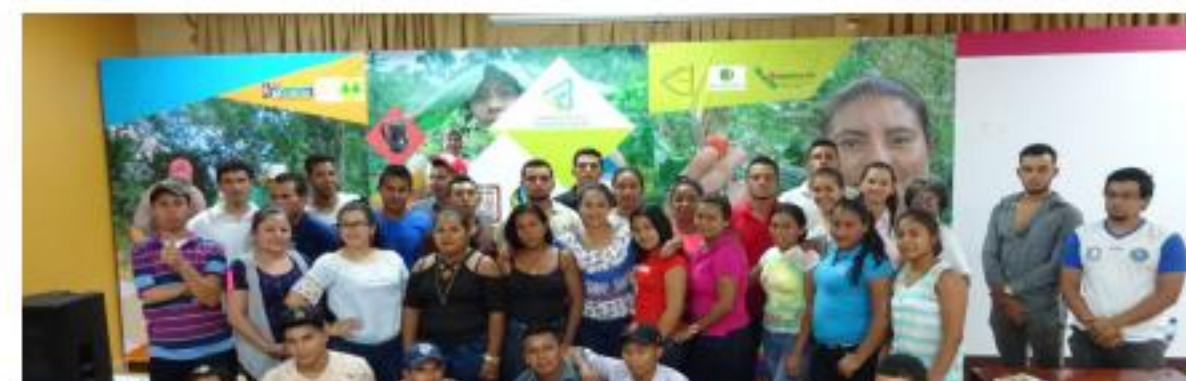
Comisión de inclusión

Finalmente, hay retos muy fuertes a los que la CNCJ-Nic se enfrenta en representación de las organizaciones ante el Estado Nicaragüense, ante el mercado internacional e internamente en el fortalecimiento organizativo, socioeconómico de las organizaciones para asegurar la lucha contra la pobreza y la desigualdad existente en el mundo.