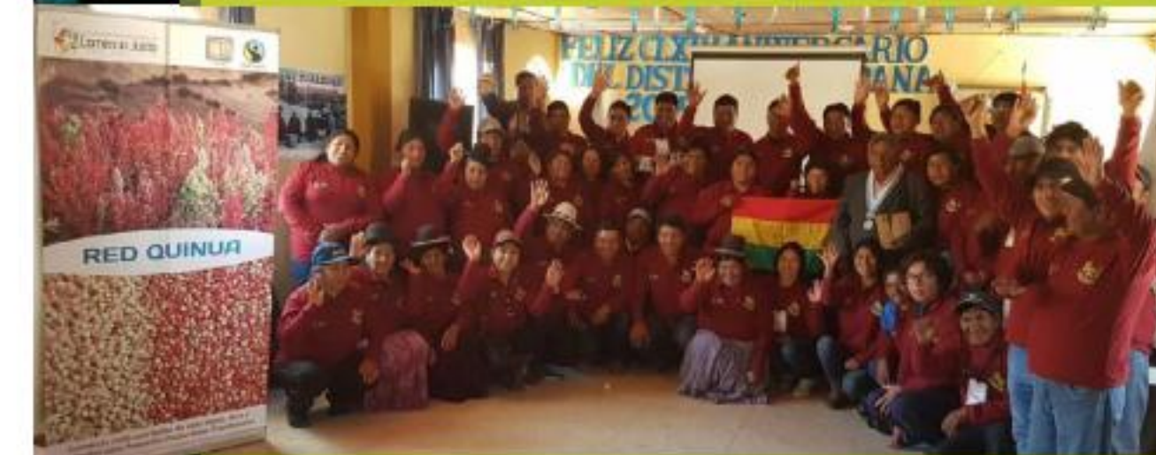
Reunión Red Quinoa Bolivia