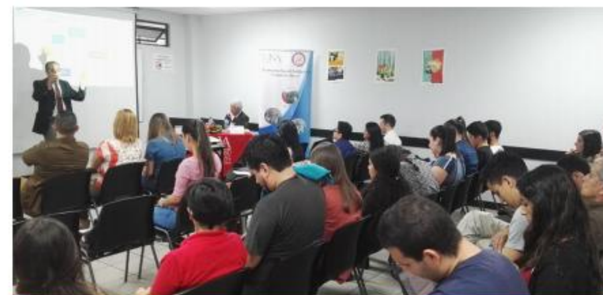
Presentación libro situación de seguros agrícolas