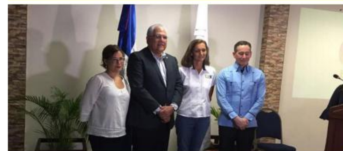
Alianza con banco BHD León