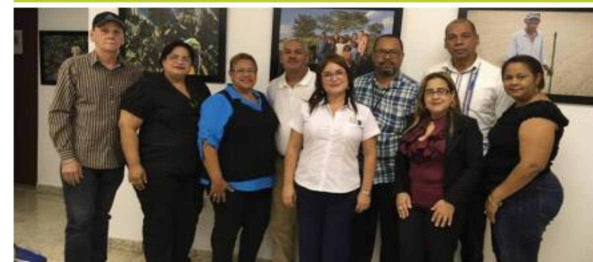
Proceso de Ciudad de Mao