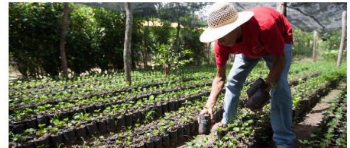
Manejo de riesgos, org. de café