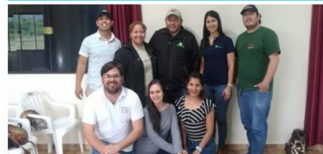
Equipo de la coordinadora