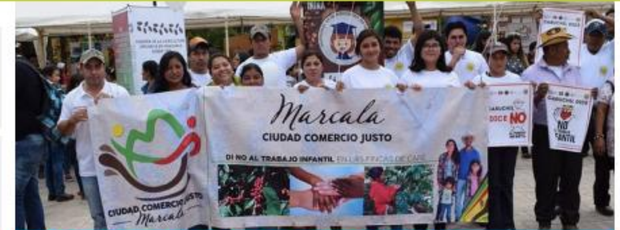
Marcala, ciudad por el comercio justo

CLAC y CHPP tienen el reto común de poder coadyuvar con el desarrollo sostenible de las organizaciones de base en Honduras. Trabajando de manera coordinada y complementaria, las organizaciones tendrán más oportunidades de fortalecerse y ser agentes de cambio comunitario.