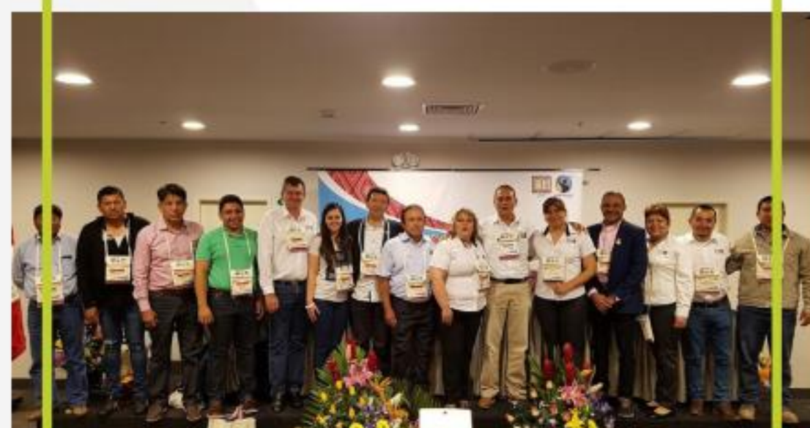
Consejo Directivo electo CLAC 2019-2021

La última sesión ordinaria del Consejo de Directores se dio el día 7 de noviembre de 2018, en el marco de la VII Asamblea de CLAC. Para su sesión de cierre, el consejo dio seguimiento a los temas de competencia desleal, mercado de café, coordinación CAN, se analizaron los acuerdos y resultados del CEO Forum y la reunión de miembros de Utrecht, Holanda.