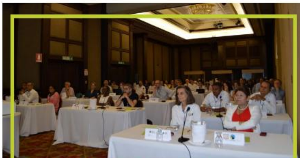
Asamblea Fairtrade International Costa Rica

Como en todas las sesiones del consejo, se recibió la actualización de las diferentes redes de productos. Además, se vieron los avances en la planificación para la realización de la VII Asamblea de CLAC que se llevaría a cabo en noviembre 2018 en Lima, Perú. En este sentido, se discutió y aprobó la agenda de la Asamblea y se revisó la Guía de Gobernanza. Dentro de la documentación de importancia para la información de la VII Asamblea de CLAC, se revisó el Plan Estratégico CLAC 2019 – 2021.