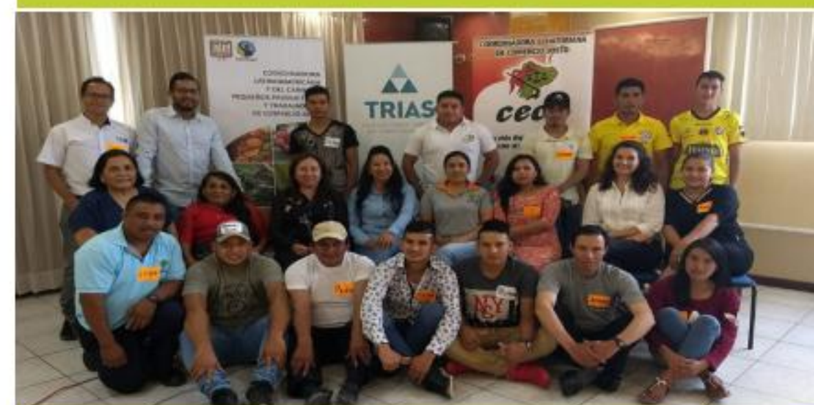
Proyecto para mujeres y jóvenes TRIAS