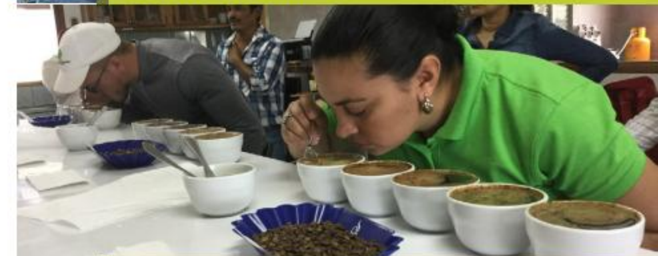
Entrenamientos Calidad de Café, Nicaragua