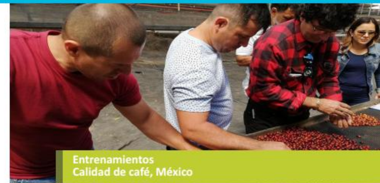
Entrenamientos Calidad de café, México

Finalmente, con vista a los planes para 2019, la Estrategia de Fortalecimiento y desarrollo se encuentra en proceso de revisión para poder presentar en la próxima Memoria Anual de CLAC.