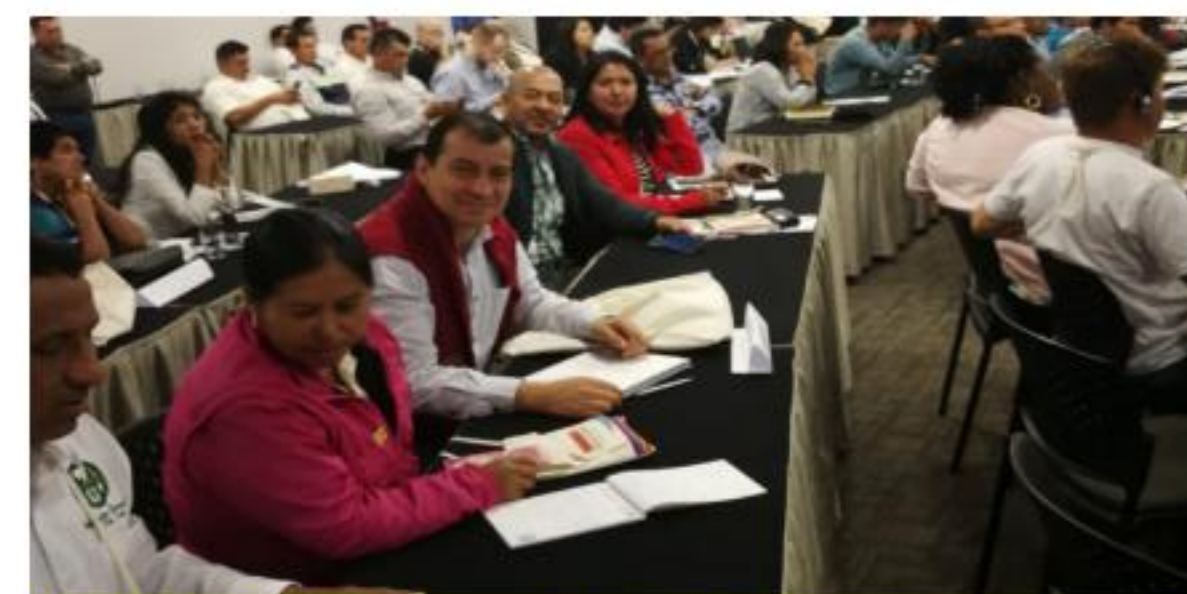
VII Asamblea General de CLAC