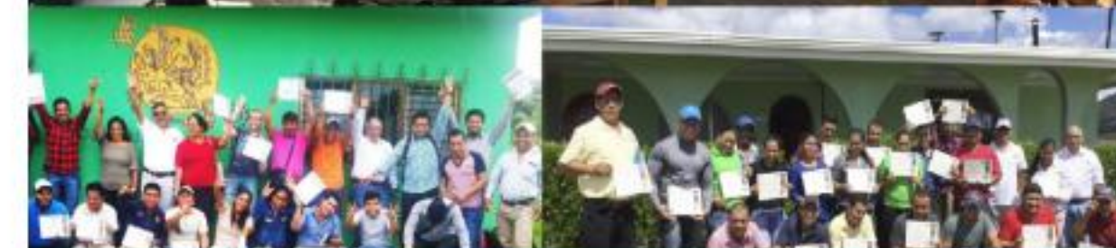
Entrenamiento en producción de café