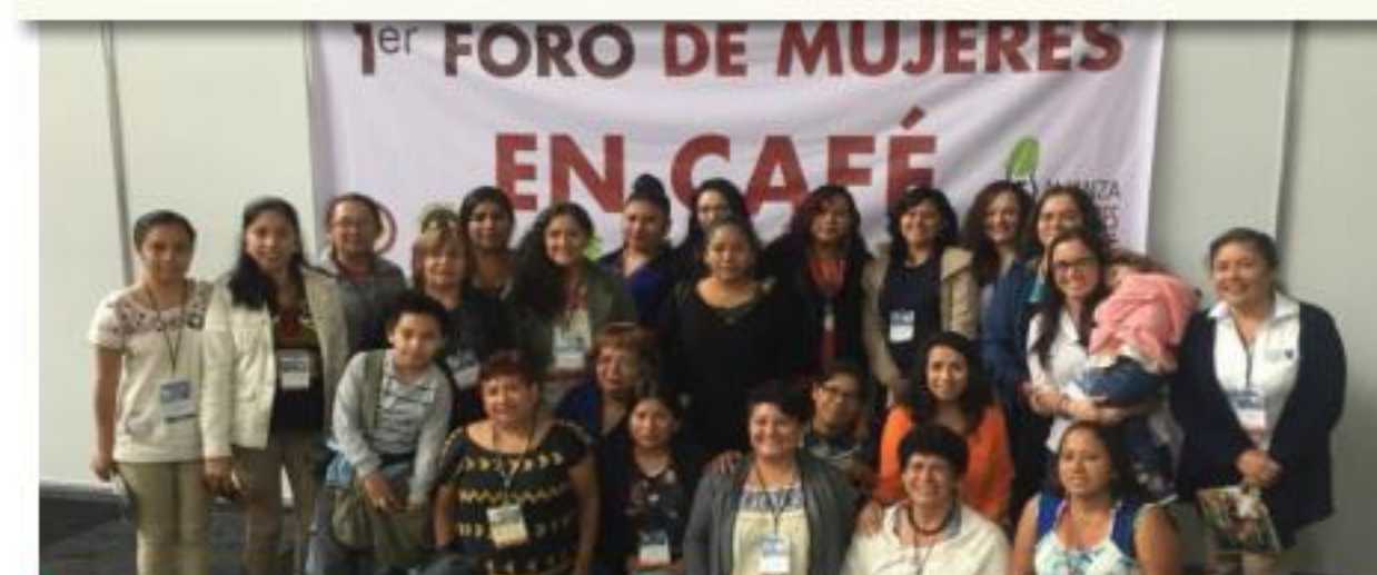
Foro de mujeres en café

Entre los retos que enfrenta la coordinadora están el desarrollar y operar un plan estratégico con indicadores, así como elaborar los procedimientos para la puesta en marcha de la política de protección infantil de la Coordinadora Mexicana. Asimismo, está pendiente la introducción de los nuevos criterios del sistema de Comercio Justo Fairtrade con las OPPs de México, además del desarrollo del mercado Sur – Sur en el país. Finalmente, continúa el desafío de impulsar el mejoramiento de calidad del café mexicano de Comercio Justo.