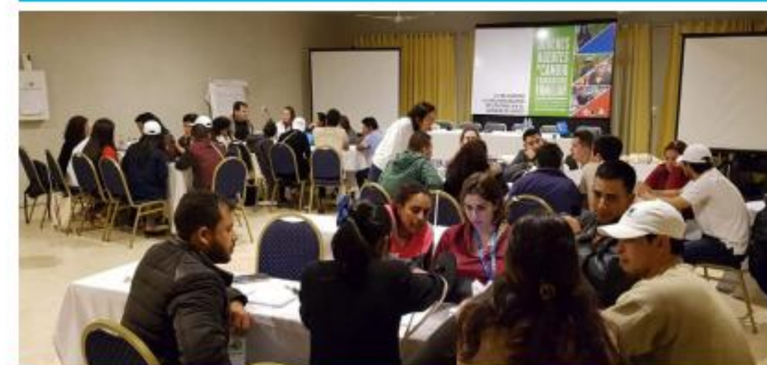
II Encuentro de Jóvenes