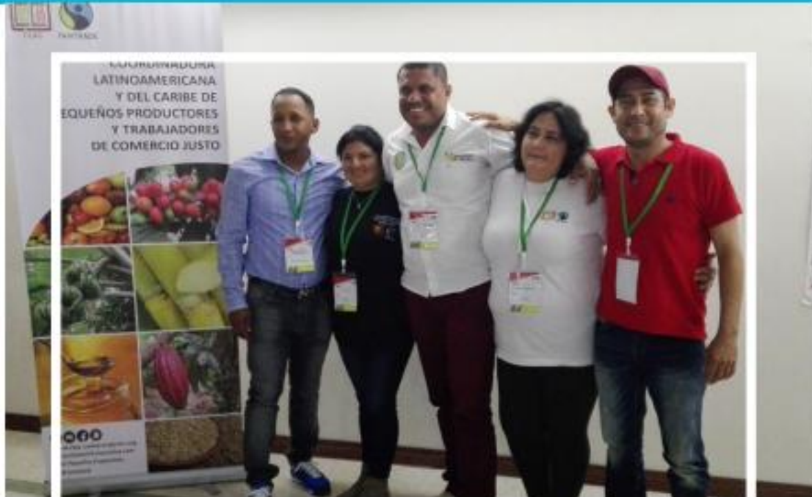
Comité de la Red de Trabajadores(as)

La Red de Trabajadores(as) de Latinoamérica de CLAC desde sus inicios en el año 2015 ha promovido de manera permanente y constante el fortalecimiento de procesos democráticos e inclusión en cada una de las plantaciones certificadas.