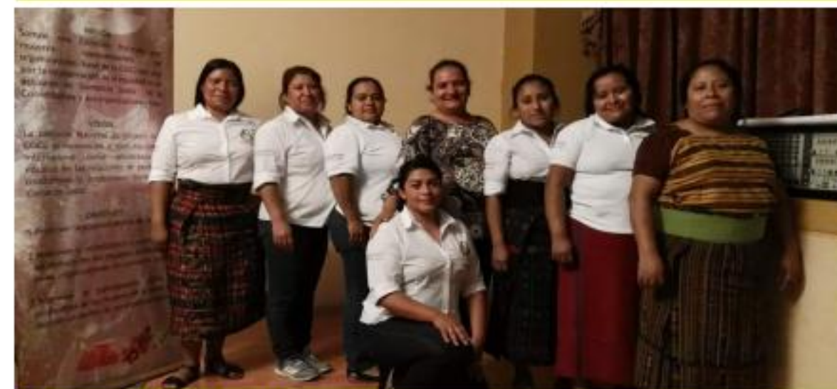
Comisión de lideresas