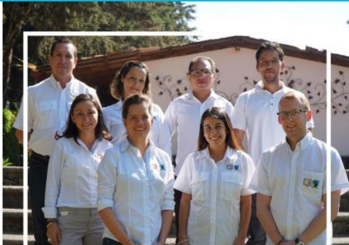
Equipo de Programas y Proyectos

Cuando en el 2016 CLAC decide implementar la Unidad de Gestión de Programas y Proyectos, el reto era que el trabajo de esta unidad se articulara con las otras acciones de CLAC para desarrollar un modelo de trabajo que respondiera a la naturaleza, principios, valores y misión que CLAC tiene como institución.