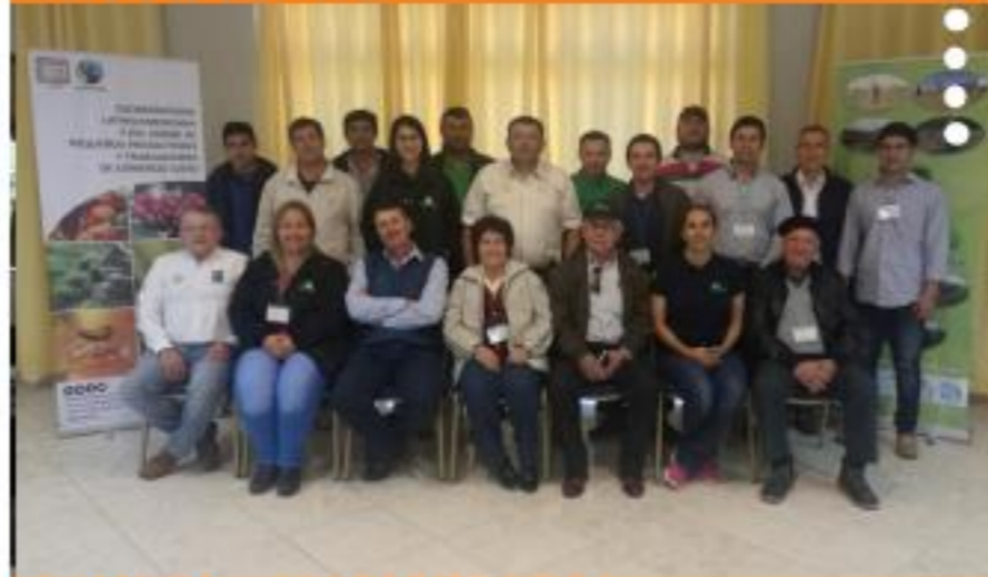
PERÚ - SULLANA