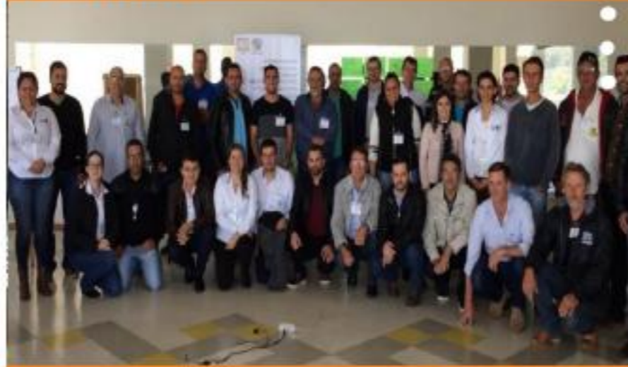
COLOMBIA - MEDELLÍN