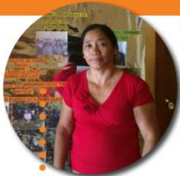
ILCE ESCALANTE PROCAFEM, México

“En Coopsol todos creemos que el compartir y trabajar en conjunto aporta a la diversidad y sinergias para crecer como personas”. El comercio justo me ha permitido encontrar una red idónea en relación a mis valores y visión sobre las actividades en el medio rural, con la cual mi organización no solo certifica para los consumidores, sino para mantener y mejorar cada día, democratizando los espacios y sobre todo aportando oportunidades a jóvenes y mujeres a participar en redes más grandes a la propia organización.”