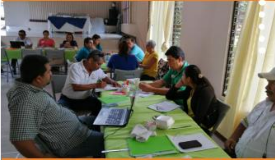
COLOMBIA - VALLEDUPAR