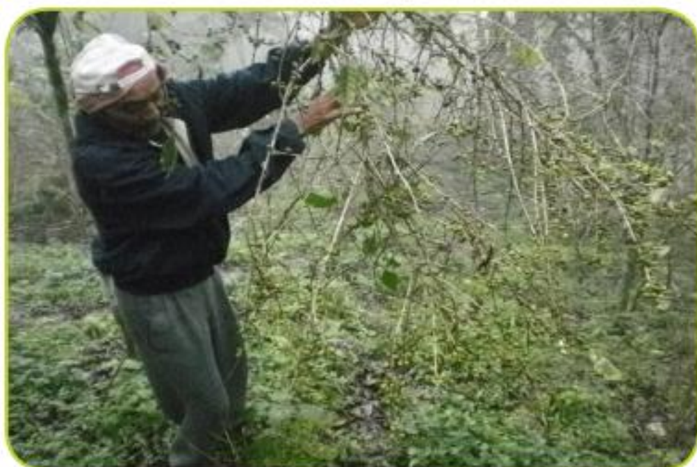
Problema de roya en cafetales mexicanos y otras frutas frescas. En la primavera 2013, además, hubo varias heladas inesperadas en la región de Curicó.